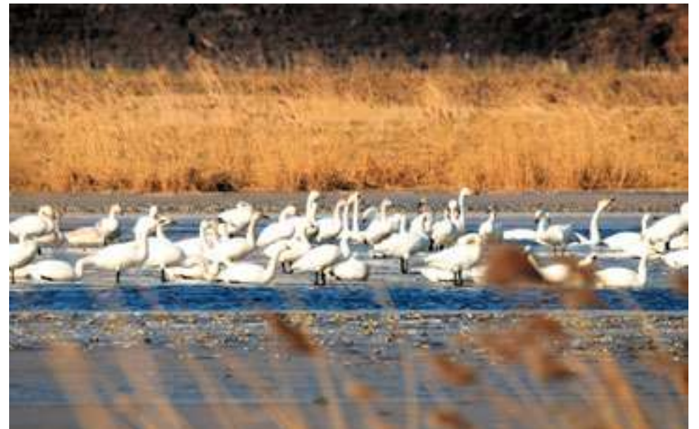
Kleine en wilde zwanen bevolken de vloevelden.

De relatie tussen natuur en landbouw komt de laatste jaren ook aan bod bij de vraag of de vloevelden moeten worden aangewezen als Natura 2000-gebied. “Volgens de normen voldoet de populatie kleine zwanen aan de criteria om het Natura 2000 te maken. Maar wat is de meerwaarde? Het is geen doel om een middel te bereiken. Staatsbosbeheer zou daardoor wel meer geld voor beheer kunnen krijgen om het gebied in stand te houden.” Natura 2000 is een beschermd gebied om biodiversiteit veilig te stellen. Het is misschien ook wel een schrikbeeld van omliggende