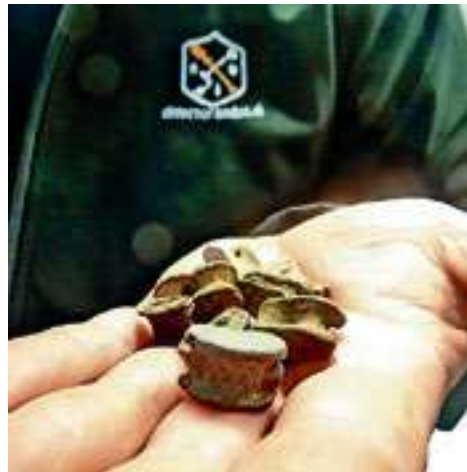
Metalen bikkels van het gelijknamige spel zijn deel van de bodemschatten.

munt. Iemand moet honderden jaren geleden met pijn in zijn buik naar huis zijn gegaan om te vertellen dat hij het muntstuk is verloren. Het gaat mij niet om het hebben. Het is de kick van het vinden en het verhaal erachter."