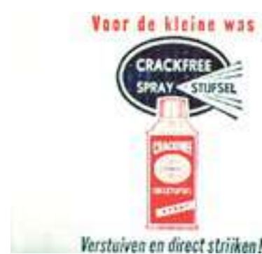
Crackfree en andere producten werden gefabriceerd bij de aardappelmeelfabriek Onder Ons.

De aardappelmeelfabriek heeft veel betekend voor de ontwikkeling van het dorp. Hij zorgde voor werkgelegenheid en woningbouw.