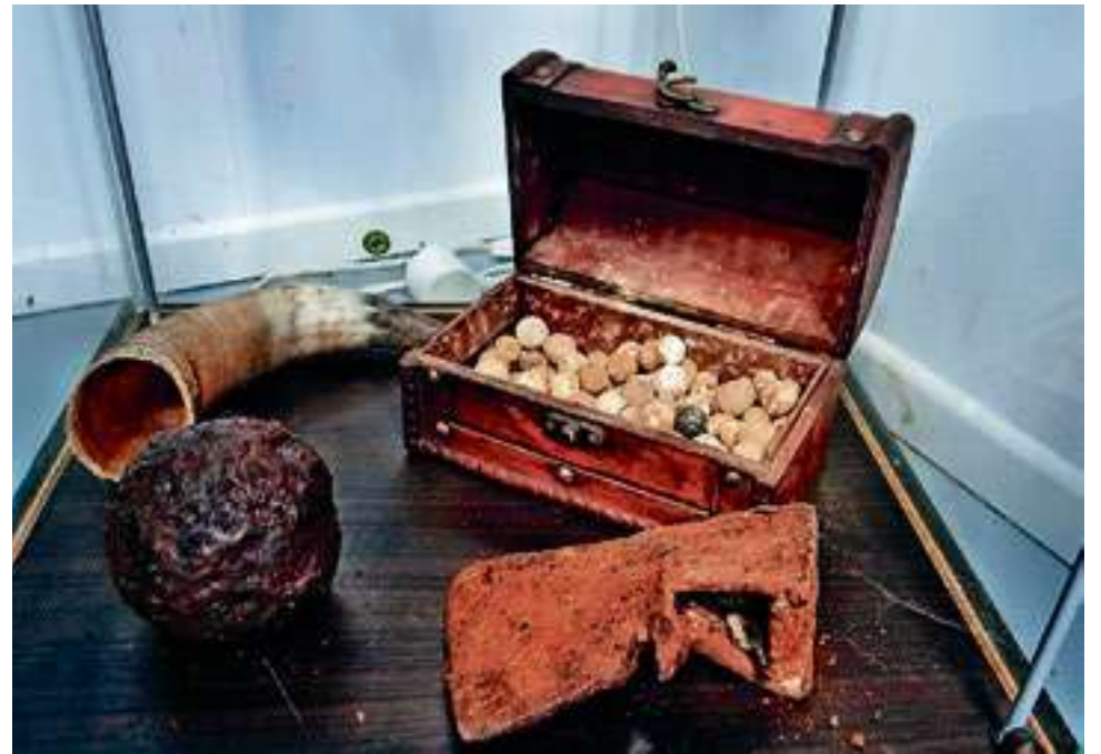
De sporen van de Tachtigjarige Oorlog zijn in de vorm van kogels terug te vinden in het Vechtdal.