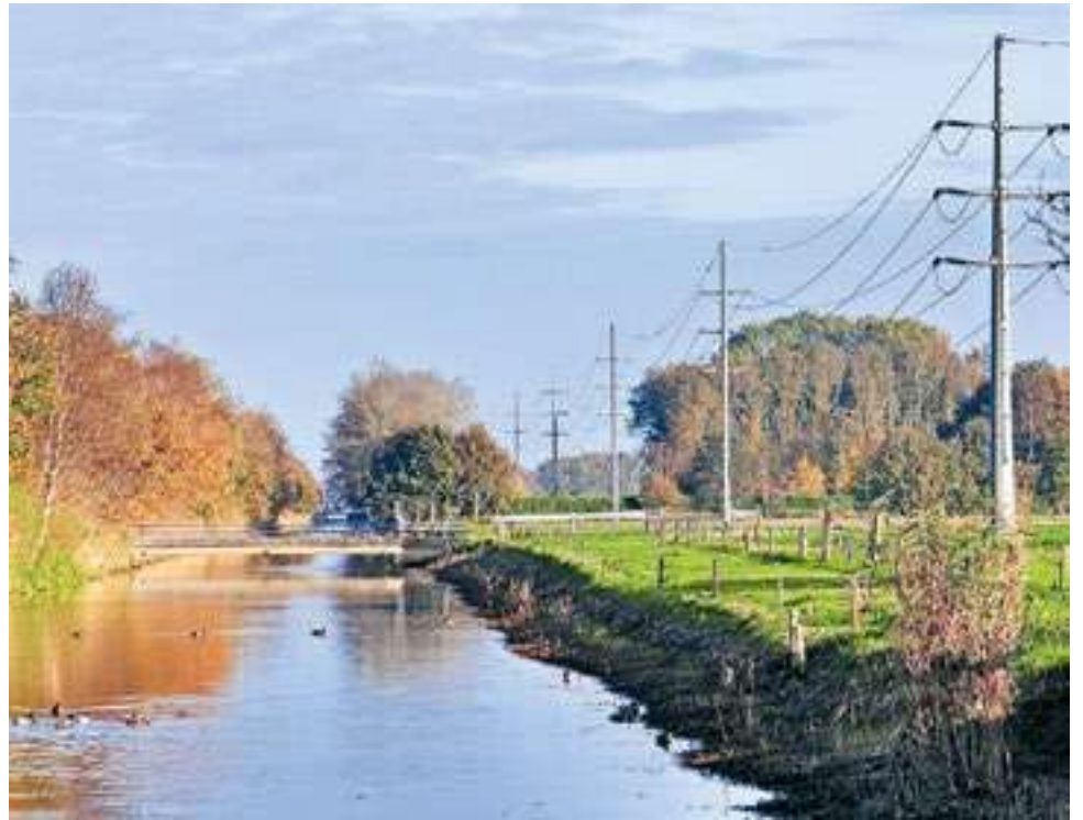
De kleinere masten tussen Dedemsvaart en Slagharen (langs het Ommerkanaal) kunnen in de toekomst weg worden gehaald.

De volgende stap in het proces is om te kijken of de voorkeurstrajecten ook in de praktijk kunnen worden uitgevoerd. Het gaat dan niet alleen om de ingediende reacties. De route van de nieuwe leidingen is tot nu toe vanaf de