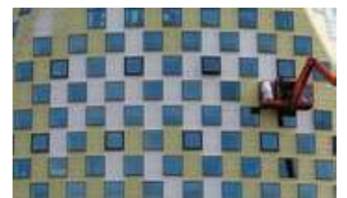
Tijdens de bouw van het gemeentehuis in 2012 waren de diverse lagen van de gevelafwerking te zien.

middelen is een optie, maar kan leiden tot het verlies van garantie op de water afdichtende gevelbekleding.