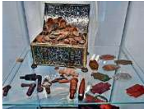
Rijwielpaaltjes, tapkraantjes en munten. Deze afgesleten munten zijn slechts een deel van de collectie van de vinder. "Elk muntje staat voor een kwartier zoeken."