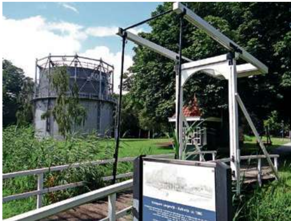
Gashouder Dedemsvaart staat naast kalkovens en plaggenhut. Een ophaalbrug vormt de toegang tot het terrein.