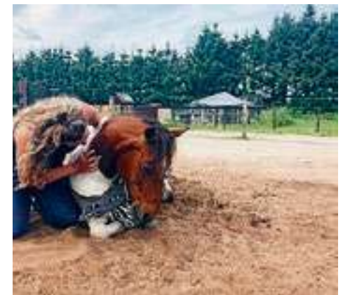
Hedy & Bonté.

Buitencentrum Het WIJ-land Rheezersend 37 7701 BC Dedemsvaart Tel: 06-22291151 www.hetwijland.nl