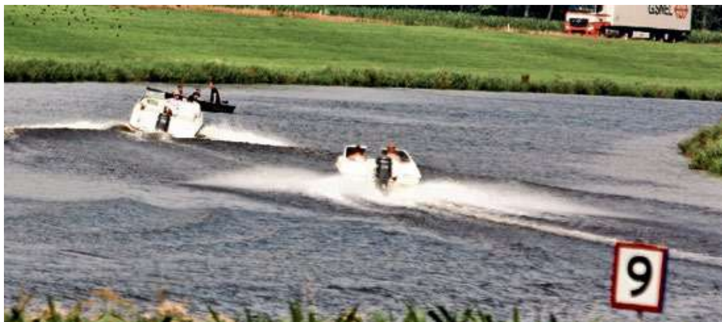
Een voorbeeld van overtreding van vaarregels op de Vecht.

De provincie geeft toe steken te hebben laten vallen. In een evaluatierapport stond dat vorig jaar duidelijk. “Voorschriften van in de bestaande natuurvergunning opgenomen monitoring en evaluatievoorschriften zijn niet goed uitgevoerd”, is de conclusie. Monitoring is zelfs niet door de provincie uitgevoerd. Overijssel was daardoor geheel afhankelijk van de gegevens van het waterschap over sluispassages. “Een gemiddeld aantal sluispassages per dag is echter niet een-op-een te vergelijken met het maximaal aantal vaarbewegingen binnen de vaartrajecten. Dit maakt een goede beoordeling niet mogelijk”,