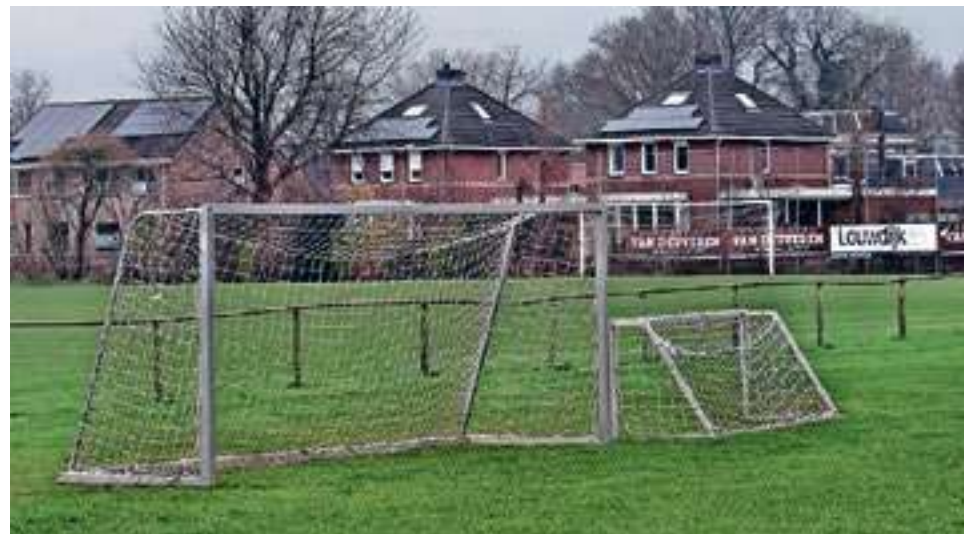
Het huidige sportpark De Boekweit in Dedemsvaart.

werkende ventilatiesystemen. De gemeente wil daarom 135.000 euro uittrekken voor het wegwerken van achterstallig onderhoud. "Met het voorstel kunnen de verenigingen verantwoord en veilig gebruik blijven maken van de accommodatie tot het moment van renovatie dan wel verplaatsing", aldus het college. Ook wordt een kunstveld vervangen. De gemeente zegt dat de levensduur van een kunstgrasveld twaalf tot veertien jaar is, afhankelijk van de benuttingsgraad. Het huidige veld op De Boekweit is vijftien jaar oud. Een nieuw veld was niet opgenomen in de meerjarenplanning van de gemeente. Daar is een oplossing voor gevonden. Volgens de planning is in 2024 een van de velden op sportpark De Boshoeke in Hardenberg aan de beurt voor vervanging (veld 5, HHC). In overleg met de voormalige