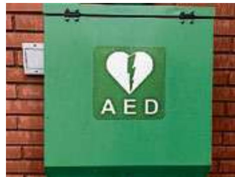
De aed bij De Baron in Dedemsvaart is ieder moment van het etmaal bereikbaar.

De politiek krijgt signalen dat twee plaatselijke belangen niet blij zijn met de huidige regels. "Ik zou twee op zichzelf een aardige score vinden", meent de wethouder. "Het is een illusie om te denken dat iedereen tevreden is. Ook als je naar honderd procent financiering