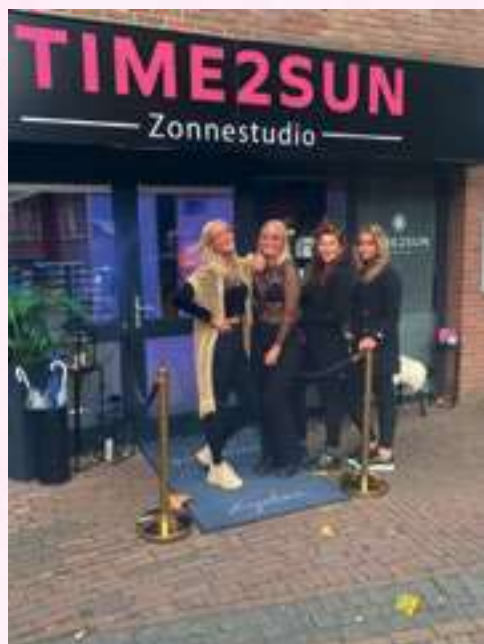
MIDDENPAD 2, HARDENBERG

Ervaar zelf de positieve effecten van de zonnebank