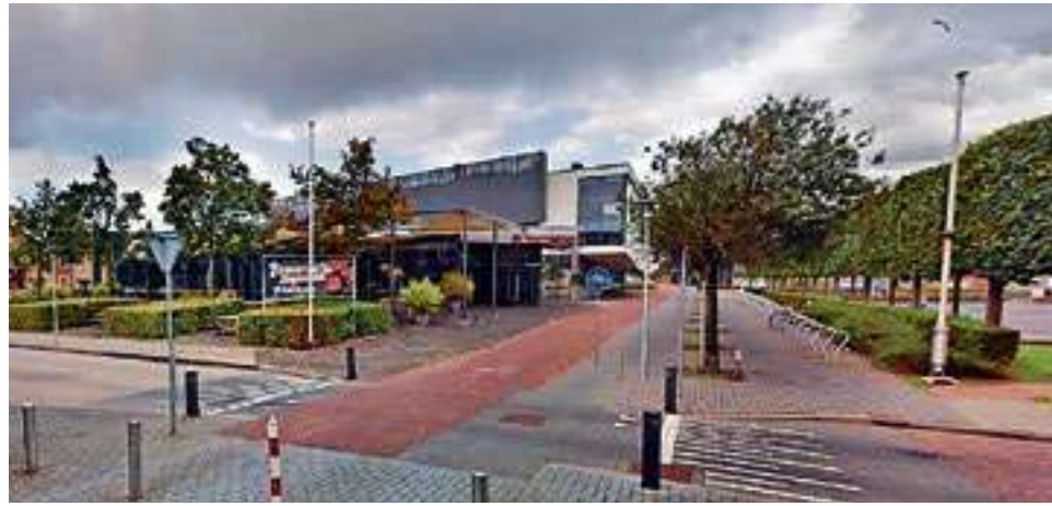
Theater De Voorvechter is uit zijn jasje gegroeid.

HARDENBERG – Nieuwbouw van theater De Voorvechter in Hardenberg is niet uitgesloten. Burgemeester en wethouders noemen die optie in een brief aan de gemeenteraad. Daarin wordt gesproken over renovatie van het huidige gebouw of een nieuw onderkomen. “We hebben in de berekeningen nog geen locatie voor eventuele nieuwbouw voor ogen, daarvoor komen we in een later stadium bij de gemeenteraad terug”, aldus het college.