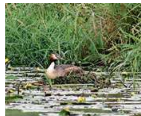
Een fuut op de Vecht vlakbij Hardenberg.

“Sinds 2018 is er veel discussie geweest over aanpassing van de vergunningen en het Verkeersbesluit Vaarwegen. Het proces hierover is de afgelopen jaren verstoord geraakt en nagenoeg vastgelopen. Om uit deze impasse te komen, is op bestuurlijk niveau samen met de ‘groene groepen’ afgesproken om te zoeken naar gemeenschappelijke vaarafspraken”, aldus een woordvoerder van Gedeputeerde Staten. “Deze afspraken beogen een goede inpassing van de vaarrecreatie binnen de natuurlijke ontwikkelingen van het Vechtdal. Dit heeft geresulteerd in het document ‘Vaarafspraken op de Vecht’. Deze vaarafspraken zijn grotendeels een herbevestiging van eerder gemaakte afspraken, maar met scherpere