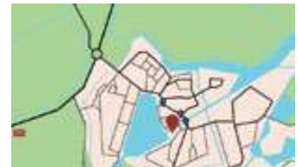
Locatie pop-up openluchttheater

lekker en voedzaam eten en de rol ervan in het vormgeven van identiteit en gemeenschap.