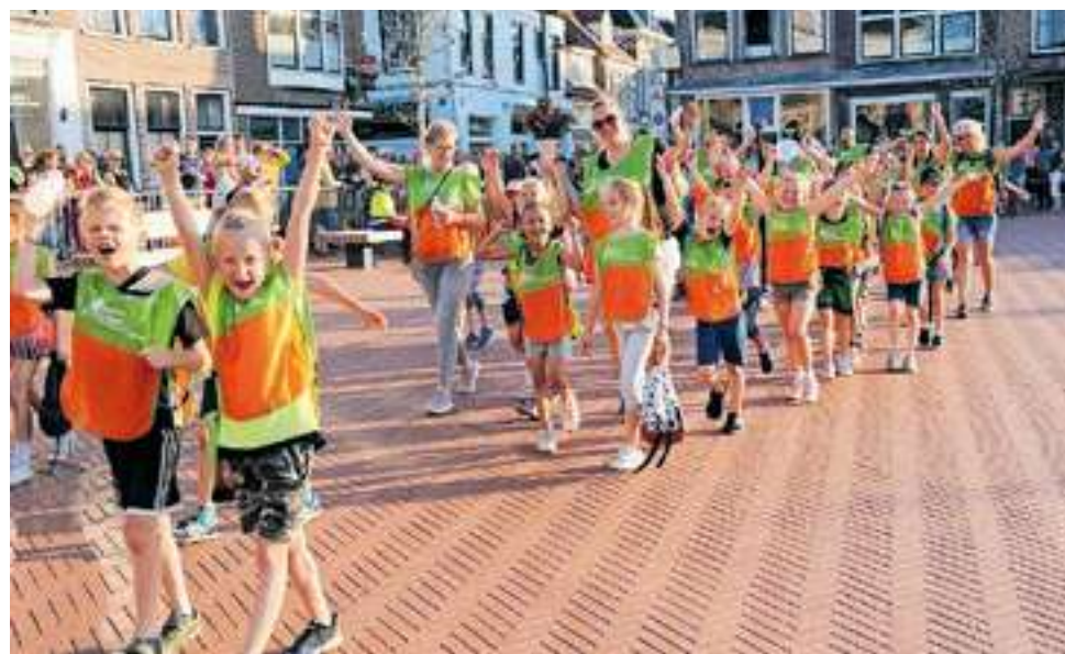
De Avondvierdaagse is sinds jaar en dag het grootste volksfeest van Steenwijk.