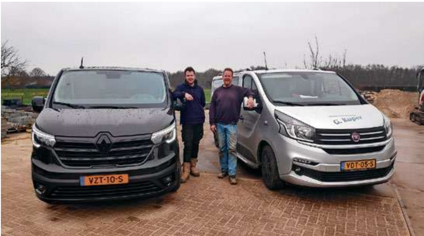
De mannen Kuper bij de auto's.