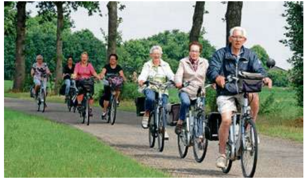
Fietsers door het natuurschoon van Steenwijkerland, tijdens de jaarlijkse fietsvierdaagse.