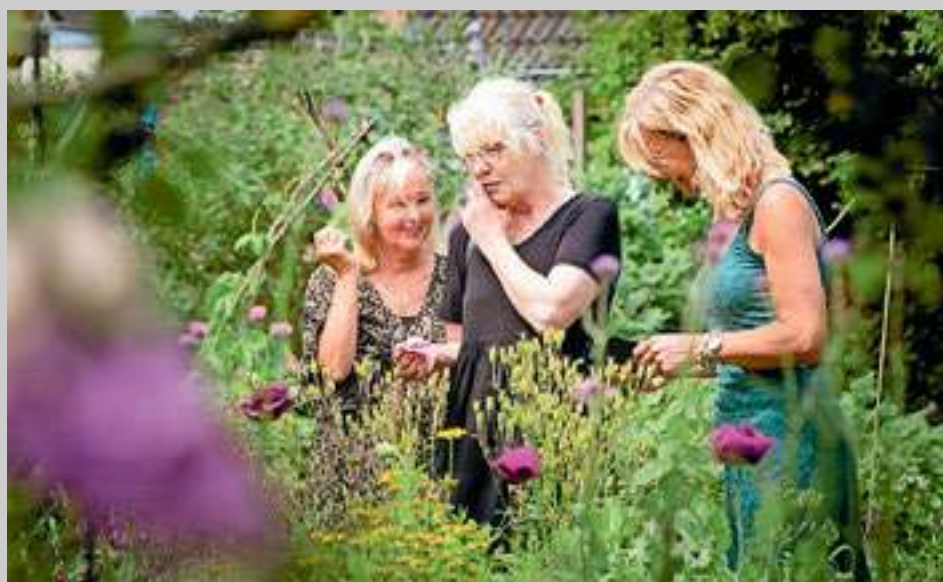
Bezoekers tijdens de Levende Tuinenroute in 2022