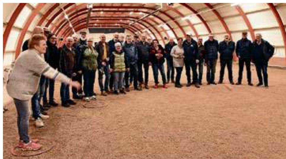
Op een doordeweekse avond wordt er in de hal van De But'84 volop jeu de boules gespeeld.

Over de exacte invulling van veel feestelijkheden wordt nog nagedacht. Toch staan er al wat zaken op de sportieve en feestelijke rol. "Op 4 oktober is het dus officieel veertig jaar De But'84. Een dag later op zaterdag 5 oktober willen we het officieel vieren in ons clubgebouw. Denk daarbij aan een receptie voor leden, oud-leden en bestuurders. En ook officials van de bond." Daarvoor staat er ook al het nodige gepland. "Want tijdens de zomerse Vestingfeesten wordt er dit jaar ook jeu de boules gespeeld op het marktplein." Ook is er een NK binnengehaald. "Het gaat om het NK doublette mix. Dus teams van twee personen, bestaande uit een man en een vrouw. Er worden negentig tweetallen op ons complex verwacht en wethouder sport Bram Harmsma doet de opening." Ook de jeugd van Steenwijkerland wordt zeker niet vergeten. "Want het is onze bedoeling om een Petanque sportdag te houden voor de groepen zeven en acht van de basisscholen."