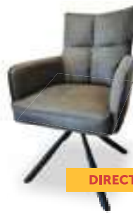
Eetkamerstoel Detroit In 3 kleuren leverbaar