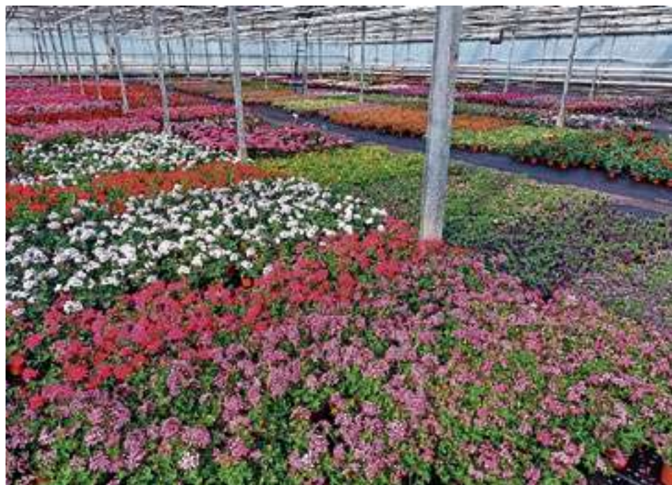
Zo'n driehonderd soorten, sommige in wel dertig verschillende kleuren.

bloembollen en verkopen we verschillende herfstbloeiers, zoals chrysanten." In het winterseizoen verkoopt de kweker onder meer verschillende soorten tulpen en violen uit de eigen kwekerij. "Daarnaast verkopen we rond de decembermaand kerstbomen en heeft de winkel een ruime keuze aan bloemen en planten die echt het kerstgevoel geven. In het voorjaar kun je bij ons terecht voor bloembollen in de pot, zoals narcissen en blauwe druifjes, verkopen we veel zomerbloembollen en wordt er al een start gemaakt met het perkplantenseizoen. In diezelfde periode hebben we ook een ruime keuze aan verschillende kleuren tulpen die uit onze eigen kwekerij komen."