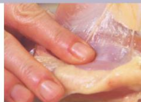
Een voorbeeld van hoe bindweefsel eruit ziet

Bindweefsel (fascie) is het weefsel dat alle spieren en organen omhult en alles in het lichaam met elkaar verbindt en bij elkaar houdt. Het is rijk aan zenuwen, bloedvaten en lymfvaten. Het bindweefsel heeft letterlijk contact met elk ander systeem van het lichaam. Het hebben van soepel bindweefsel is van vitaal belang voor onze algehele gezondheid en welzijn. Op microscopisch niveau omhult bindweefsel namelijk elke cel van ons lichaam.