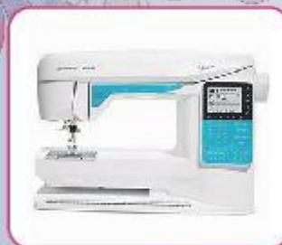
Husqvarna Opal 650

Van onze demonstratie en show modellen Naaimachines – lockmachines – Borduur machines voor een hele scherpe prijs