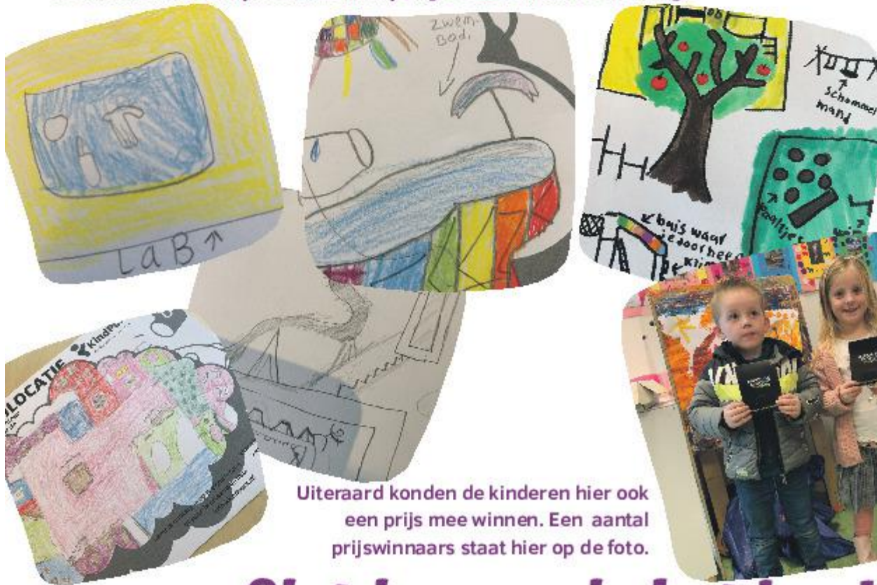
Uiteraard konden de kinderen hier ook een prijs mee winnen. Een aantal prijswinnaars staat hier op de foto.

De kinderen van KindPunt hebben, in de aanloop naar de nieuwe planperiode voor het Strategisch beleidsplan, hun visie op hun droomlocatie kunnen geven. Kinderen hebben op allerlei manieren kenbaar kunnen maken welk beeld zij hebben bij een droomlocatie. Honderden ontwerpen zijn bekeken en de beste ideeën zijn meegenomen om verwerkt te worden in de plannen. De jury bestond uit de leden van de KindPuntraad. De KindPuntraad bestaat uit afgevaardigde leerlingen van de groepen 7 en 8 van alle locaties van KindPunt. In de KindPuntraad worden allerlei zaken besproken die de locaties betreffen. De leerlingen brengen zelf hun agendapunten in en onder leiding van hun eigen voorzitter worden de onderwerpen besproken. De actiepunten die hieruit voortkomen worden (indien haalbaar) uitgevoerd binnen de stichting.