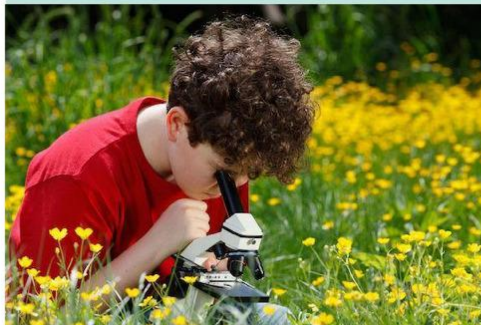
De natuur neemt binnen het vrijeschoolonderwijs een belangrijke plek in.

Om het animo onder ouders en (toekomstige) leerlingen te peilen, is het mogelijk om op de website van de initiatiefgroep vrijblijvend een interessepeiling in te vullen. Ook kunnen belangstellenden zich via de website aanmelden voor de nieuwsbrief van de initiatiefgroep. Kijk voor meer informatie op https://oortgezetvrijeschoolonderwijsmeppel.nl/ .