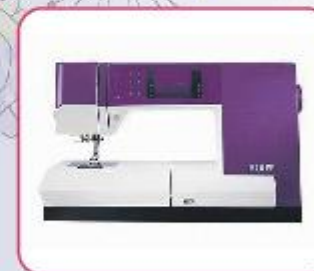
Pfaff expression 710

Reparatie alle bekende merken naai- lockmachines & gratis parkeren voor de deur