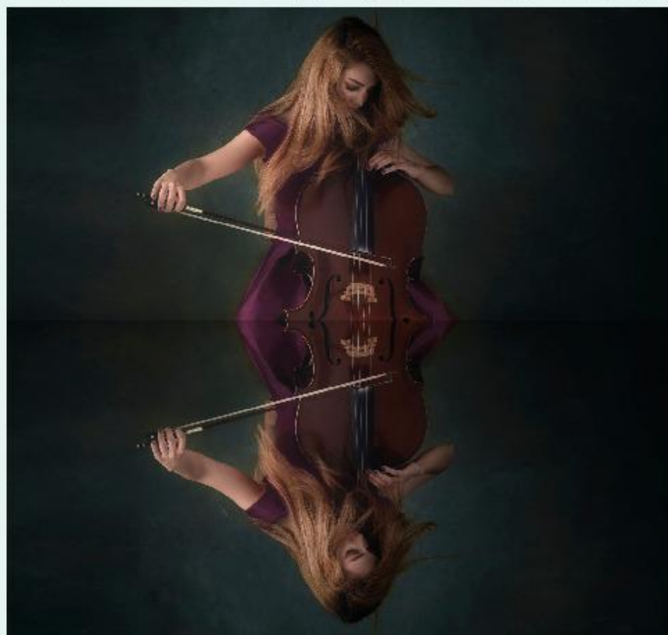
Klassiek, maar ook pop, aan de overkant van het water.

Het hele evenement is vrij toegankelijk. Met hulp van veel vrijwilligers en sponsors kan het georganiseerd worden. De organisatie vraagt bezoekers om Symphonica Stadshagen te steunen met een vrijwillige bijdrage, zo dat het een jaarlijks terugkerend muziek- en cultuurfestival in Zwolle kan zijn. Als vrijwilliger meehelpen aan het evenement of alvast iets doneren? Kijk dan op www.symphonicastadshagen.nl .