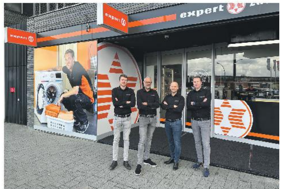
Personeel Zwolle Zuid