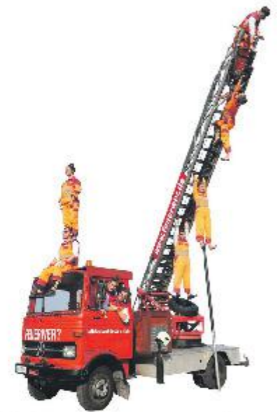
Halsbrekende toeren zijn te verwachten van FeuerWer?

weekeinde, zoals het Zwolle Design Festival, Draadloos Straatmuzikantenconcoors, de innovatieve foodmarkt van Kennispoort en de Deltion Afstudeervoorstellingen.