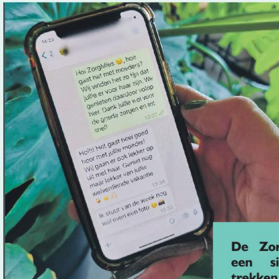
Geen zorgen tijdens de vakantie.