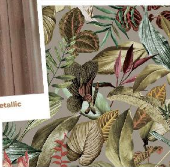
Farrow & Ball Dove Tale no. 267