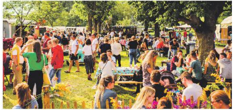
Beeld van een voorgaande editie, toen nog in het ter Pelkwijkpark.

Maar Lepeltje Lepeltje is meer dan eten en kramen. Bands en djs zorgen voor passende muziek 's Middags zijn dat fijne deuntjes en sfeermuziek. Zodra de zon vertrekt en de borrel begint, gaat het tempo vanaf het podium omhoog. Lepeltje Lepeltje is er ook voor de kinderen. Daarom is er op zaterdag en zondag kindervertief te vinden in het park en kan het kroost de handen uit de mouwen steken. De klassieke schommels nemen weer plaats in het park en dienen als speeltuig voor de grote en kleine durfals. Ondertussen kunnen de