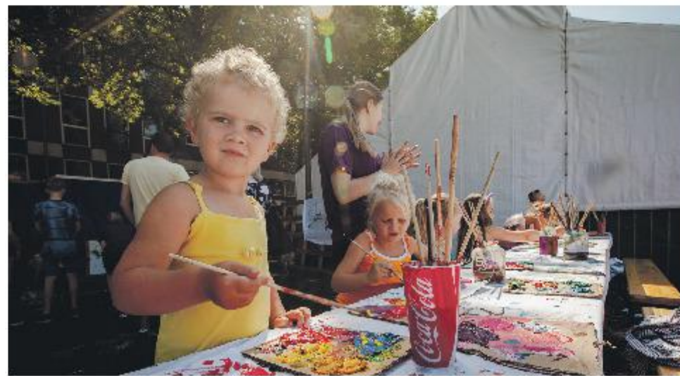
Nieuwe dingen leren is het credo.

Een evenement voor kinderen van 4 tot 12 jaar. Dat is Festival Nemia op 27 en 28 mei in Zwolle. Het zit stampvol kinderdoe-activiteiten en biedt daarnaast The Flying Acrobats, Caribisch kinderconcert Bon Dia, vertelvoorstelling De Koning van Katoren, Hiphopkinderdshow Frenk de Slak en het komisch acrobatenduo Diego&Joanes. Nemia is gratis toegankelijk, want cultuur en kunst zijn van iedereen.