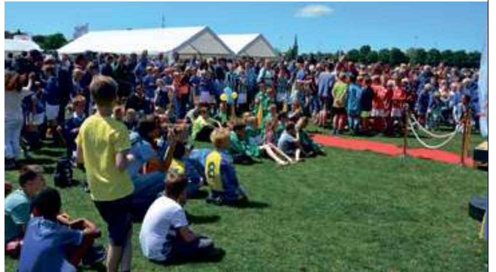
Negen jaar geleden was de bekerfinaleledag bij Olde Veste een groot feest.

"We zullen ongetwijfeld het draaiboek van de vorige keer nog hebben liggen. Maar daarnaast: we organiseren wel meer grote toernooien dus ook dit gaat goed komen", aldus Dolstra die blij is met de uitnodiging. "Daaruit blijkt de waardering vanuit de bond."