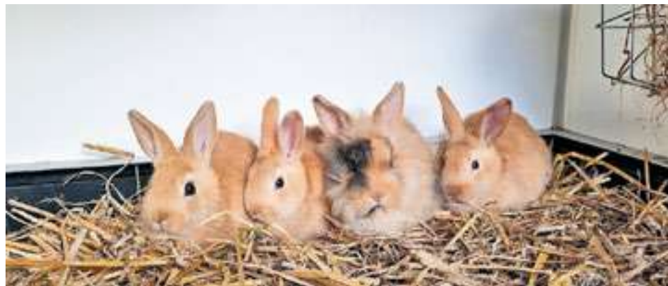
Een paar lieve konijnen zoeken een nieuw huis.

DE BLESSE- Stichting Opvang Konijnenparadijs, gevestigd in De Blesse, vangt al jarenlang konijnen op uit verschillende regio's. Naast de opvang biedt de stichting ook (tweedehands) producten aan in de winkel en is er een vakantie-pension waarbij het konijn uitstekend verzorgd wordt. Nieuwe vrijwilligers zijn hier altijd welkom!