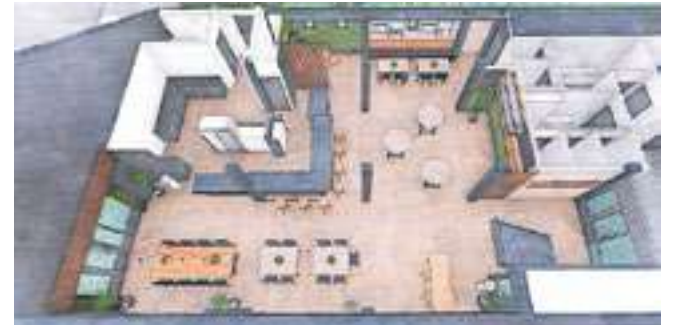
Straks een nieuwe bar en nieuwe keuken.

In 2022 wordt gestart met het samenstellen van twee commissies: de bouw- en de interieurcommissie. De bouwcommissie bestaat uit acht leden en er zijn ongeveer twintig vrijwilligers bij betrokken. De interieurcommissie bestaat uit zes personen en zal in een later stadium bijspringen. “Voor de bouwvak kon nog asbest geruimd worden en kon de sloop van start gaan. Begin oktober zijn we begonnen met de opbouwfase. Dit alles kon gerealiseerd worden door het ontwerp en tekenwerk van B en V Bouwmeesters, Bakkerbouw