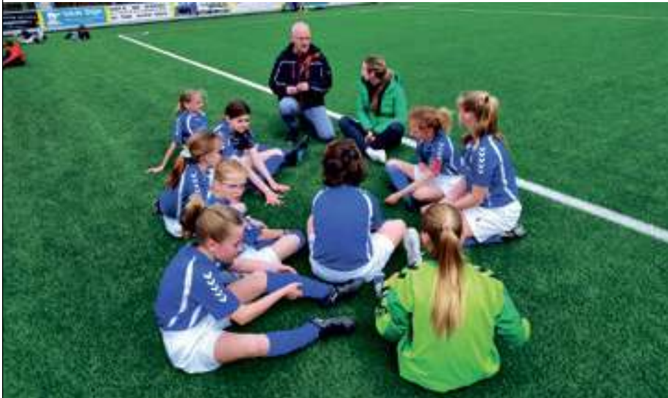
Een beeld van het schoolvoetbaltoernooi in 2023.

De twintig basisscholen in Steenwijk, Steenwijkerwold, Tuk, Giethoorn en Sint Jansklooster hebben de uitnodiging voor het jaarlijkse schoolvoetbaltoernooi van Olde Veste inmiddels weer binnen. Op woensdag 3 april gaan de jongensteams in actie komen terwijl een week later, 10 april, de meisjes op de velden aan de Parallelweg de strijd zullen aangaan.