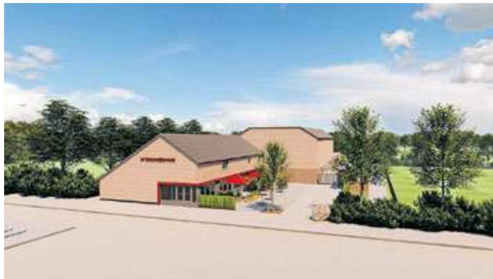
De kantine zoals die er aan de buitenkant uit gaat zien.

“Het was de bedoeling om voor het 50-jarige jubileum klaar te zijn met de verbouwing van de nieuwe kantine. Nu ligt de deadline rond april 2024. Het idee van de verbouwing ontstond ongeveer zo'n zeven jaar geleden. Er kwam behoefte aan een mindervaliden toilet (MIVA). Al een aantal jaren heeft SV Steenwijkerwold een G-team, maar geen MIVA toilet. Met de nieuwe verbouwing wordt dit gerealiseerd. De toiletten en kantine zullen in een modern jasje gestoken worden en de kantine wordt geheel van deze tijd”, geeft voorzitter Marcel Zuidema aan. Uiteindelijk startte de verbouwing wat later, maar kon al voor de bouwvak van 2023 asbest geruimd worden. De kantine dateert nog uit het begin van de oprichting van de sportvereniging Steenwijkerwold in 1973. “Die was in die zin best gedateerd. Er moest echt wel wat gebeuren. We zijn in 2021 begonnen met het oprichten van een sponsorwervingcommissie. We hebben crowdfundingacties gehouden, sponsors persoonlijk benaderd en fondsen en subsidies aangeschreven. Hierdoor kon alles doorgaan”, aldus Marcel Zuidema. Lees verder op pagina 7.