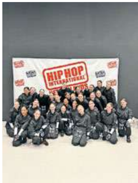
Eyecatcher wil graag opvallen en een verhaal vertellen.

Op de Nederlandse kampioenschappen en de regionale wedstrijden is Eyecatcher vaak eerste geworden. Er zijn verschillende bonden en iedere bond kent zijn eigen kampioenschappen. Voor de bond UDO is Eyecatcher naar het Europees kampioenschap geweest. Dat was voor de dansers een geweldige ervaring. Ze hebben hard gewerkt om zich te kunnen plaatsen voor dit kampioenschap. Na dag een hebben zij zich meteen weten te plaatsen voor de finale. Dit was geweldig, en de ouders en kinderen die daarbij waren zullen dit nooit