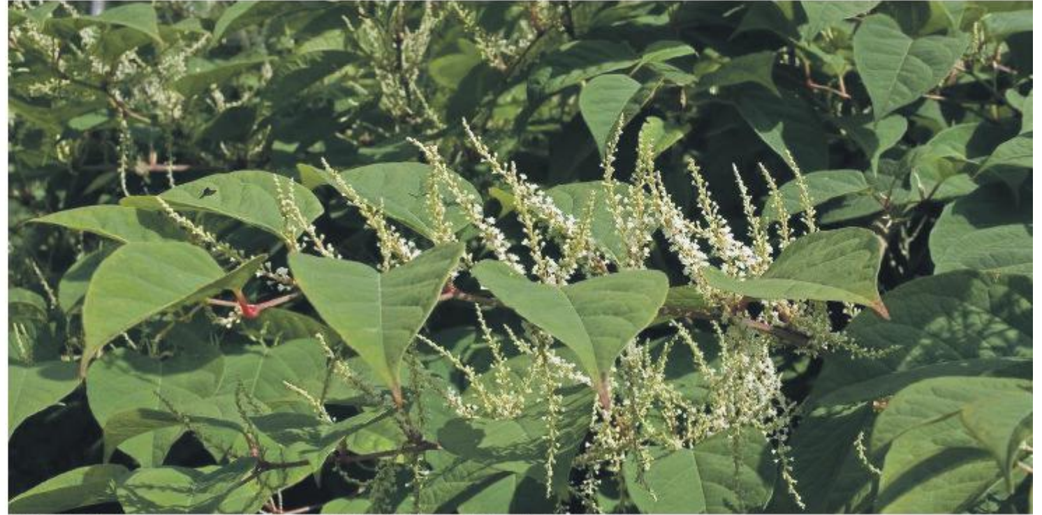
De Japanse duizendknoop kan voor grote problemen zorgen.

De gemeente heeft nauwkeurig in kaart gebracht waar de Japanse duizendknoop zich in Zwolle bevindt. Een overzicht hiervan is te vinden op https://www.zwolle.nl/japanseduizendknoop . Zie je de duizendknoop op een plek die nog niet op de kaart vermeld staat, geef het dan door via https://www.zwolle.nl/melding of via telefoonnummer 14038.