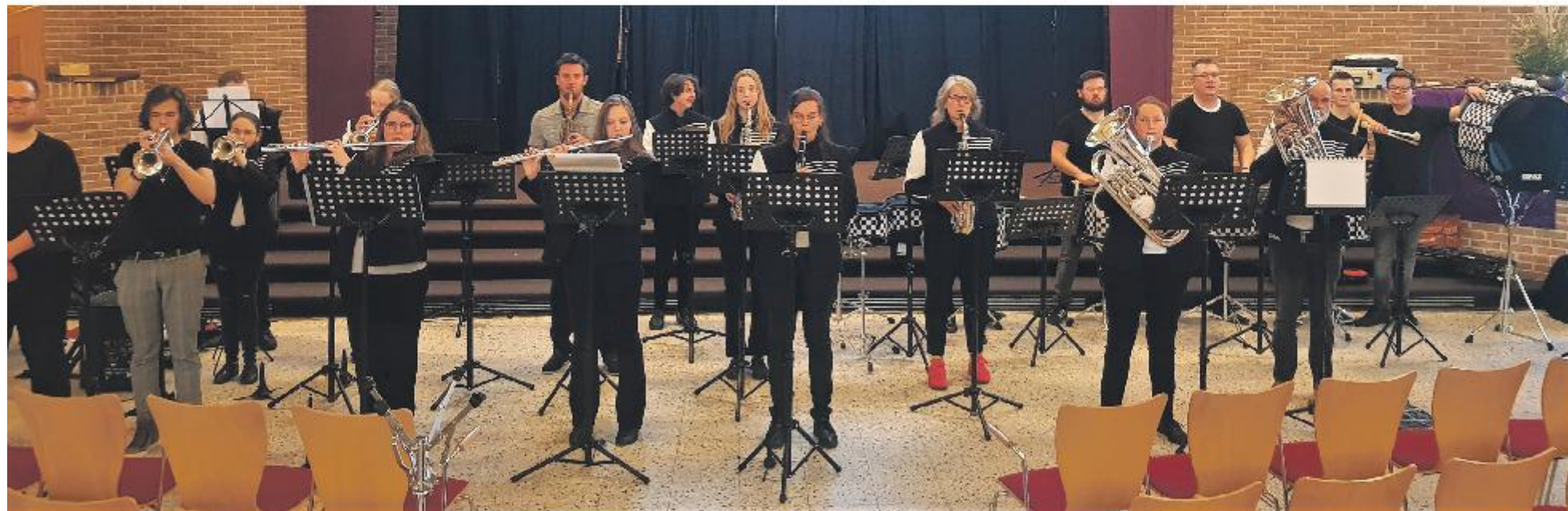
De STDSBAND tijdens de generale repetitie van 'THIS IS US!' in SIO op 14 april.

een 'show'band. Maar dan wel een die openstaat voor experimenten'. Zo traden de STDSBND en drumline Victory onlangs op in SIO, samen met Koor Swingshift. 'Dat repeteert in het Jubalgebouw, zodoende ontstond het idee om de krachten eens te bundelen. Slaat een experiment aan bij ons en het publiek, dan gaan we ermee verder. Past het niet, dan stoppen we daarmee'. Zo bleek de combinatie van muziek met toneel tijdens de laatste kerst volgens Segers te 'geunsteld'. Lachend: 'Toneel is dus niet onze kracht. Maar al experimenterend ontdek je wie je als vereniging bent. We staan nog aan het begin, zeg maar dat we nu STDSBND 2.0 zijn. Om ons nog verder in de 'juiste' richting te ontwikkelen, hebben we nu een expert binnengehaald in het omvormen van verenigingen. Eén ding is wel duidelijk: van het nieuwe Jubal gaat Zwolle nog veel horen!'