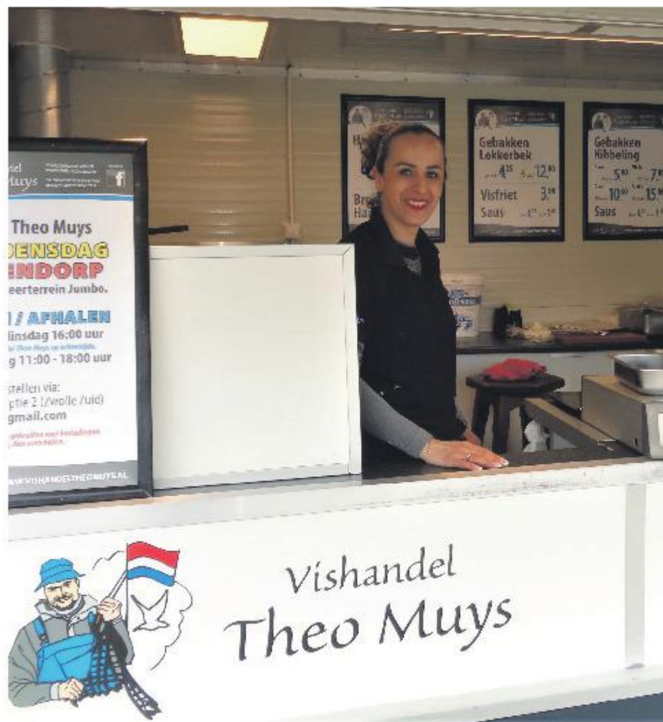
Vis is niet alleen lekker, maar ook zeer gezond. Nu ook in Assendorp.