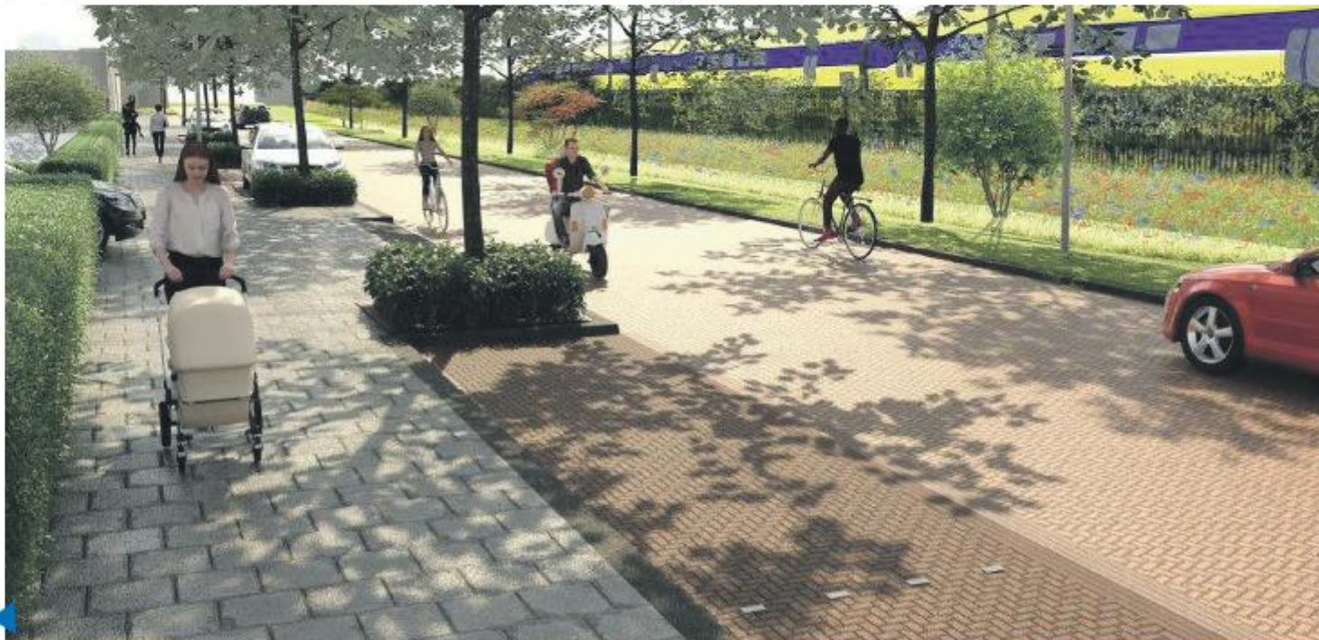
Zo moet de Oosterlaan eruit komen te zien.

Tijdens een speciale bijeenkomst hebben omwonenden positief gereageerd op het invoeren van de huisregels, omdat daarmee de overlast kan worden beperkt. Wel wordt er over een jaar op verzoek van de omwonenden een evaluatiemoment gepland, om te bespreken of de nieuwe huisregels voldoende effect hebben.