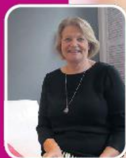
Uw gastvrouw in Zwolle

Bij Easyslim.nu is er geen sprake van het zogenaamde 'jojo-effect'. Dit komt doordat ons apparaat de spieren traint, waardoor de vetverbranding, ook in rust, stijgt. Ook wordt middels ultrasound vet uit de cel gehaald, dat op natuurlijke wijze het lichaam verlaat. Dit, in combinatie met een gezond voedingspatroon, geeft zeer snelle en blijvende resultaten. Het is heel mooi om te zien hoe blij we de mensen maken. Zij krijgen meer zelfvertrouwen, wat op alle fronten in hun leven doorwerkt. Mijn bedrijf verandert vele levens op een positieve manier. En juist dat is het succes, al 6 jaar lang.'