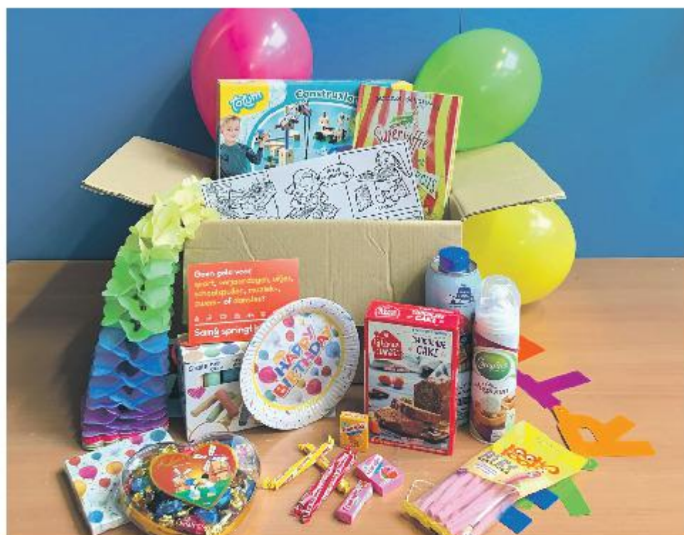
Met de opbrengst van de bingoavond kunnen tientallen verjaardagsboxen worden aangeschaft.

Kijk voor meer informatie op https://www.innerwheel.nl/ .