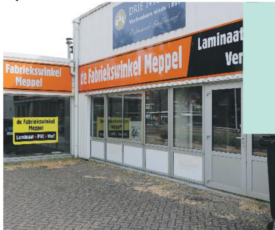
De Fabriekswinkel Meppel is gevestigd aan de Leonard Springerlaan 32B.

In het hart van de coronaperiode, februari vorig jaar, kreeg het drietal de sleutels van de loods aan de Leonard Springerlaan 32B, met de bedoeling om er outlet artikelen te verkopen. 'Wij hadden het idee om partijhandel in verf en vloeren te verkopen maar kwamen er al gauw achter dat dat toch niets voor ons was. Outletvloeren worden wel goedkoop aangeboden maar bevatten toch regelmatig fabrieksfoutjes en dergelijke. Vrij vlot zijn we overgeschakeld op het huidige bedrijf. We zijn momenteel druk bezig een wat luxere showroom in te richten, voor de verkoop van in principe A-merken. Voor de wat minder bedeelde bieden wij goede laminaatsoorten in een