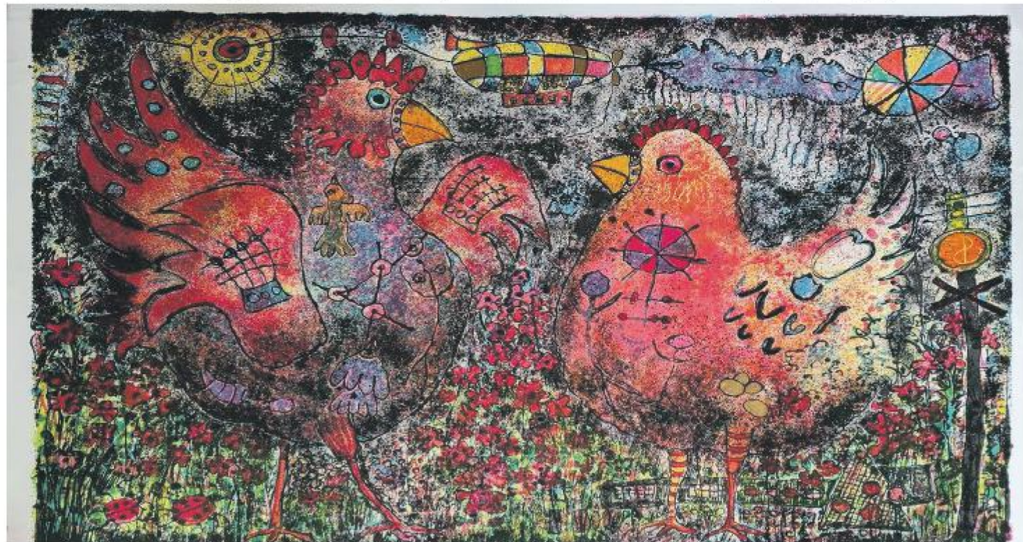
'Kip met de gouden eieren' is de grootste staaldruk ter wereld.

Meer weten? Kijk dan op https://www.drukkerijmuseum-meppel.nl/ of op https://www.facebook.com/drukkerijmuseummeppel/ .