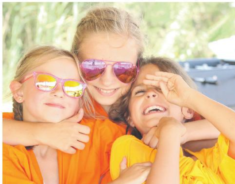
Een zorgeloze vakantie in Nederland maakt voor kwetsbare kinderen een wereld van verschil.

Wil je vrijblijvend meer informatie ontvangen of je aanmelden als vakantieouder, neem dan contact op met Jenneke van Elp via telefoonnummer 06 – 20 66 49 43 of kijk op https://paxkinderhulp.nl/ .