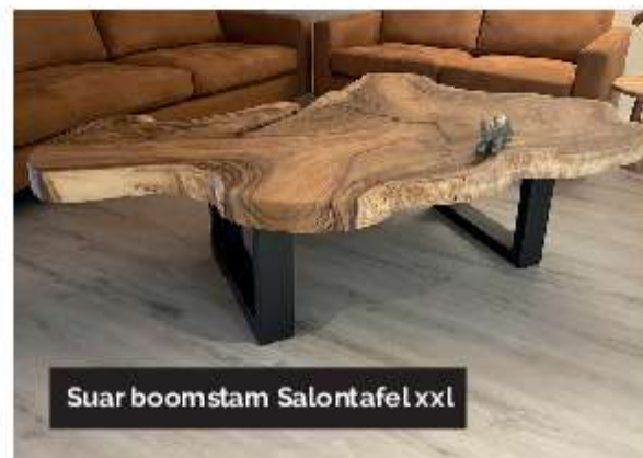
Suar boomstam Salontafel xxl