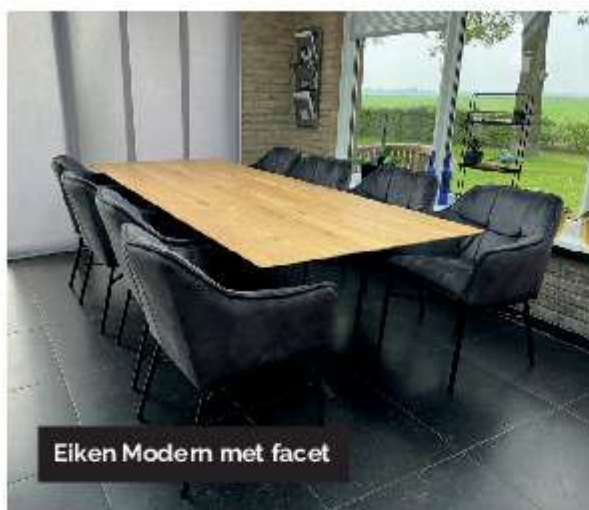
Eiken Modern met facet