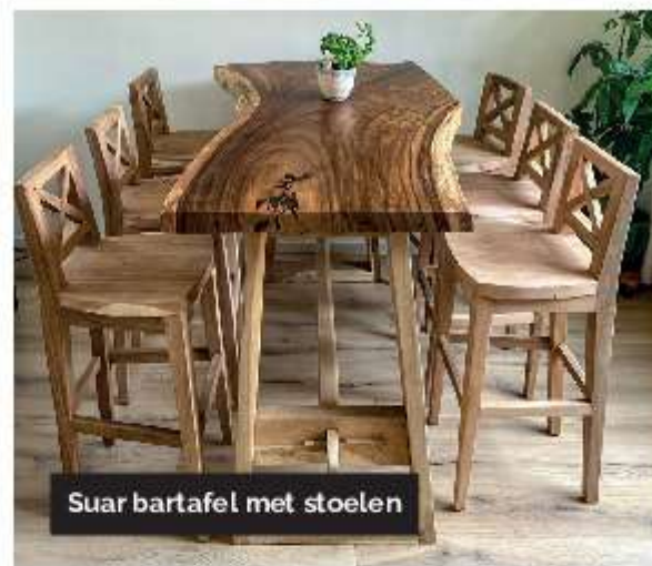
Suar bartafel met stoelen