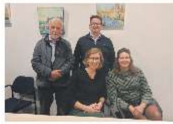
Present Meppel komt weer op stoom