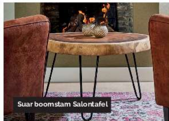
Suar boomstam Salontafel

Treetop Tables wil blijven vernieuwen. Zo zijn ze onder andere bezig met epoxy tafels en super strakke moderne noten en eikenhouten tafels in rechthoek en ovaal. Op deze manier houden Rutger en Nick de uitdagingen, ideeën en het plezier in stand.