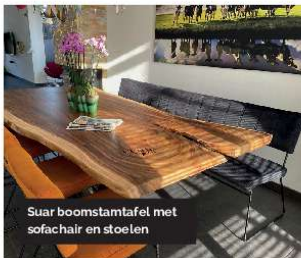
Suar boomstamtafel met sofachair en stoelen

Treetop Tables is een familiebedrijf met meer dan dertig jaar ervaring in robuust hout. De onderneming maakt bijzondere robuuste boomstamtafels. Iedere tafel heeft zijn eigen unieke uitstraling en vormt een waardevolle aanvulling op uw interieur. De collectie omvat tevens buitenmeubilair en moderne kwaliteitsstoelen van Nederlands fabricaat evenals salontafels, bartafels, bijzettafels en houten accessoires.