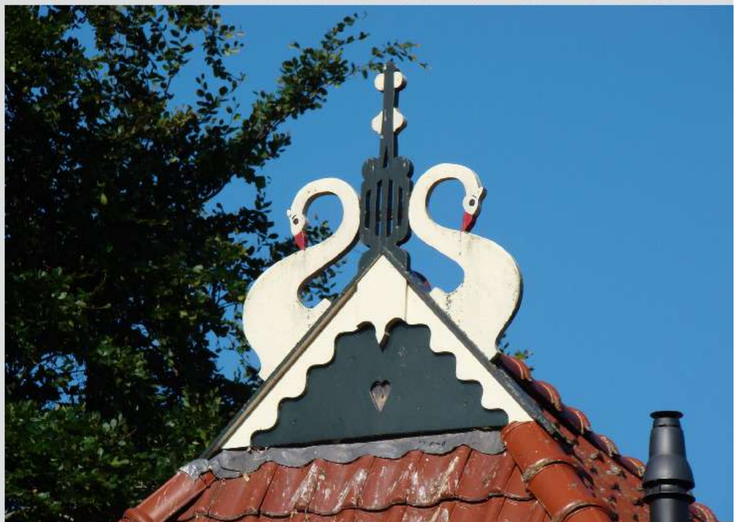
Een uilenbord op een boerderij in Sloten.

Daarom werden er stenen uilenborden gemetseld, die tot op de dag van vandaag de boerderij sieren. De boer en boerin leefden nog lang en gelukkig in hun nieuwe onderkomen. Van de duivel hebben ze nooit meer last gehad.