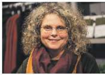
Dorris & Co