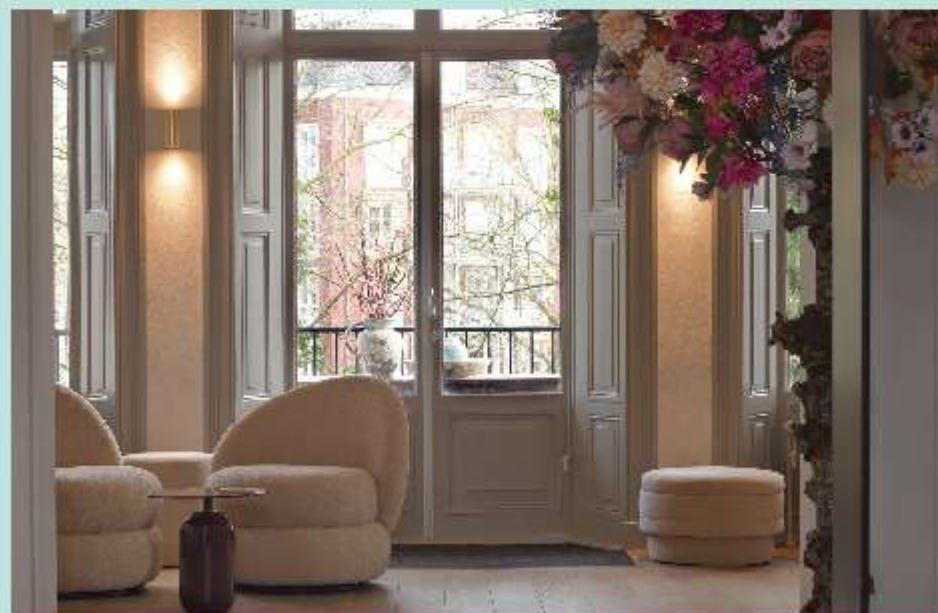
De sfeervolle en uitnodigende lounge van House of Joy & Health.

In Zwolle gaat Joy & Health ook inhoud geven aan een nieuw onderdeel van het bedrijf. Een ruimte op de eerste verdieping van het pand in hartje Zwolle biedt plaats aan een opleidingsinstituut voor meerdere doelgroepen. Vooral voor huidverzorging, maar daarnaast voor ondernemers in het algemeen en in de schoonheidsbranche in het bijzonder. www.houseofjoyandhealth.com