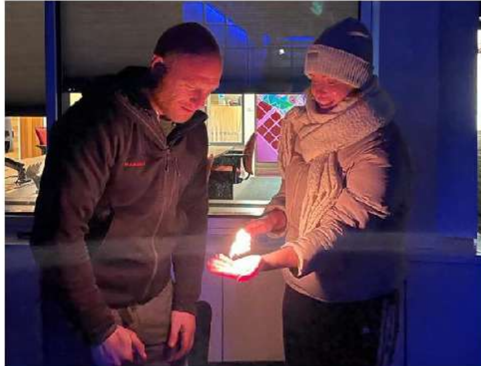
Heel diverse sessies, geregeld door Steunpunt Mantelzorg.

Niet alleen neemt de druk op formele zorg toe, óók die op mantelzorgers. En die zal nog groter worden door onder andere de vergrijzing en het langer thuiswonen van ouderen. "Iedereen krijgt wel een keer de gedachte dat er misschien een moment komt dat je die zorg nodig hebt óf zelf mantelzorger wordt. Maar het kan dus al op jonge leeftijd zijn dat dat laatste gebeurt. En ik merk dat er veel druk staat op die kinderen. Het is helemaal niet erg om bijvoorbeeld een keer boodschappen te doen voor je vader of moeder maar het moet niet jouw verantwoordelijkheid