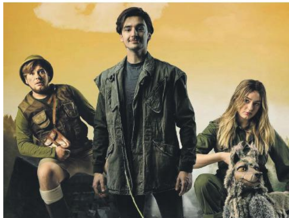
JungleBoek de Musical

De tien theaters in Regio Zwolle werken intensief samen op het gebied van o.a. programmering, marketing en bedrijfsvoering. De voordelen van deze samenwerking zijn onder andere dat het theaterpubliek daardoor meer keuze heeft.