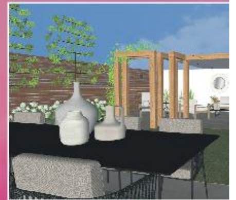
P18 Ben jij al lente klaar?