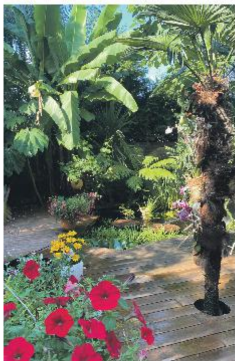
Combinatie van grote bladplanten en bloeiers

Over de sierwaarde zijn de meningen verdeeld. Het is niet zo eenvoudig om deze planten, die veel aandacht opvragen, te combineren met andere planten. Combinaties met gangbare tuinplanten zijn moeilijk te maken. Veel ontwerpers en hoveniers weten niet goed raad met deze zogenaamde architectonische planten. De tuinen in ons land waar palmen en bananen zijn toegepast, zijn bijna allemaal propvolle collectietuinen waar vormgeving ondergeschikt is aan verzameldrift. Geslaagde combinaties met Trachycarpus zijn te maken met grote groepen lage bodembedekkers zoals Cyclamen , Ophiopogon , vetplanten of lage siergrassen. Het groepsgewijs aanplanten van palmen in verschillende grootte, geeft echter een veel losser en natuurlijker resultaat. In formele tuinen zijn palmen en bananen makkelijk inpasbaar langs paden of in vakken met gazon, grint, maaskelen, steensplit e.d.