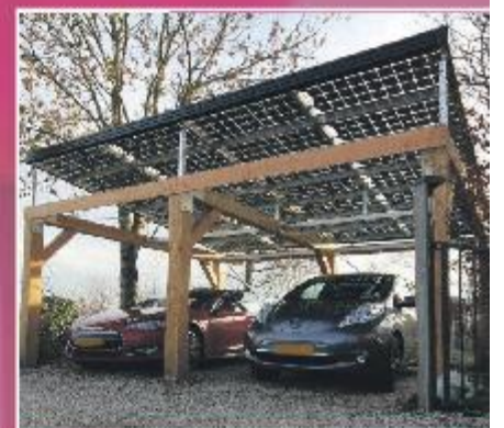
P22 Zonnepanelen en Solar Carports