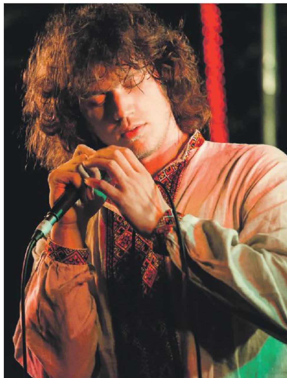
Zelfs de boks van de zanger zijn sprekend die van Jim Morrison.

Wie zich in de jaren 20 alsnog wil onderdompelen in het sixtiesgevoel van festivals als Woodstock, Monterey, Fantasy Fair, het Isle of Wight Festival en het Magic Mountain Music Festival, moet op zondagavond absoluut naar Hedon in Zwolle komen. Al of niet met een bloem in je haar. Aanvang 19.30 uur, zaal open 18.30 uur. Prijs 29 euro.