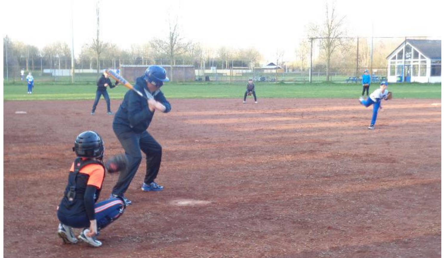
Concentratie tijdens het pitchen.

Honk- en Softbalvereniging Blue Hawks Zwolle Bellinistraat 45 8031 LM Zwolle www.bluehawks.nl Telefoon (038) 454 5134