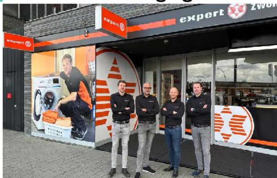
Het team in Stadshagen

Er zijn nog maar een paar grote ketens overgebleven en juist die missen het serviceniveau en de passie die onze mensen kunnen bieden. We profiteren van een zeer professionele marketing en expertise bij Expert, waardoor wij ons juist kunnen blijven focussen op datgene waar we echt goed in zijn: het verlenen van de allerbeste service. Onze slogan blijft dan ook: 'Onze service maakt het verschil'. Zo zijn we echte keuken-inbouwspecialisten. We verzorgen desgewenst de complete installatie van alle apparatuur bij je thuis." Maar ook wasautomaten, drogers, koelkasten, vaatwassers en natuurlijk IT-apparatuur, klein huishoudelijk, tv en audio. "We verkopen het, geven de juiste uitleg en onze eigen monteurs installeren het. En daarbij hoort ook dat we indien gewenst je nieuwe televisie voor je aan de muur bevestigen en gelijk je soundbar