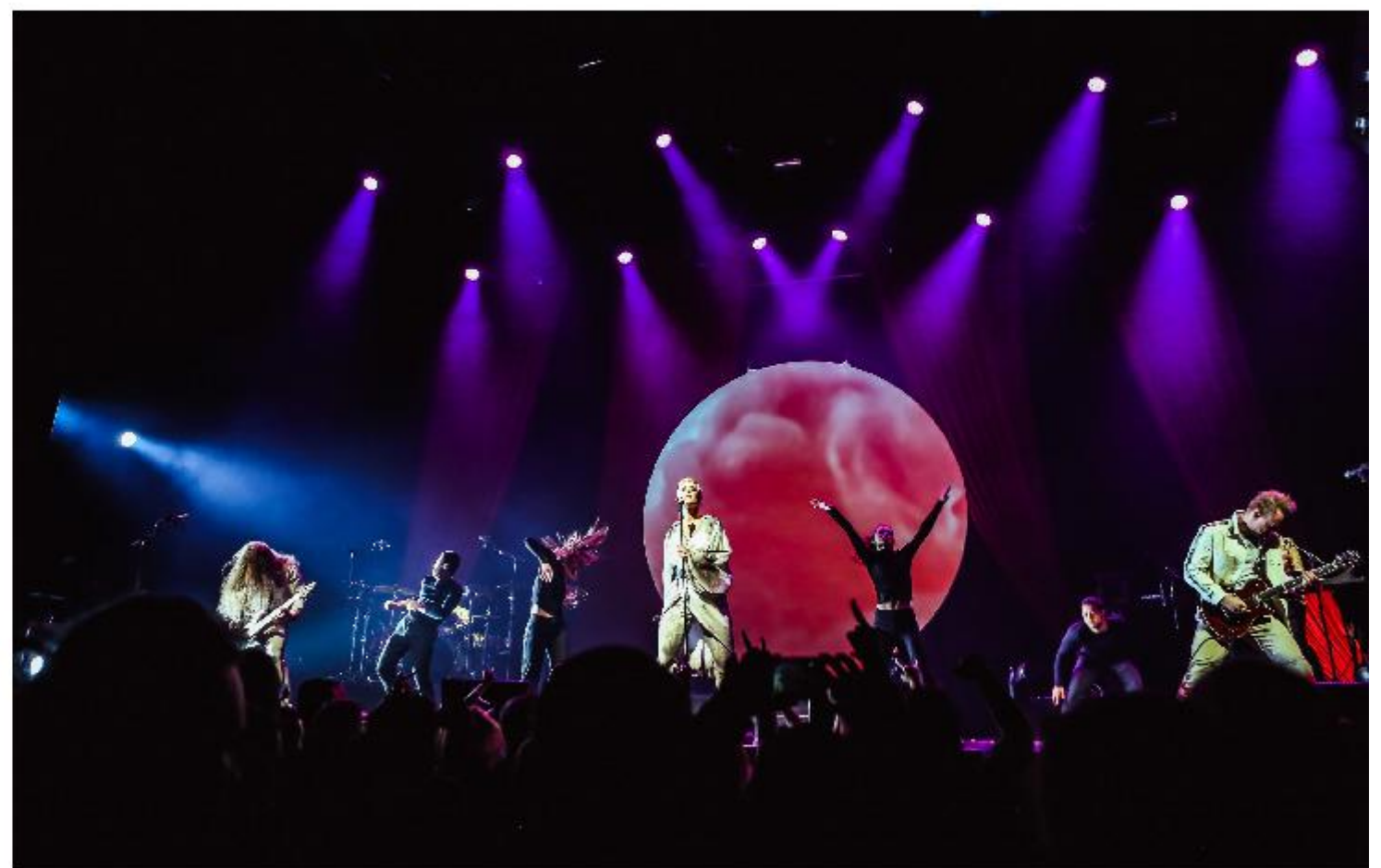
Een beeld uit de videoclip bij de single 'Alles Wat Ik Wil'.

“In Zwolle wandel ik graag via het Kerkbrugje naar park de Wezenlanden. Een heel bijzonder stukje”