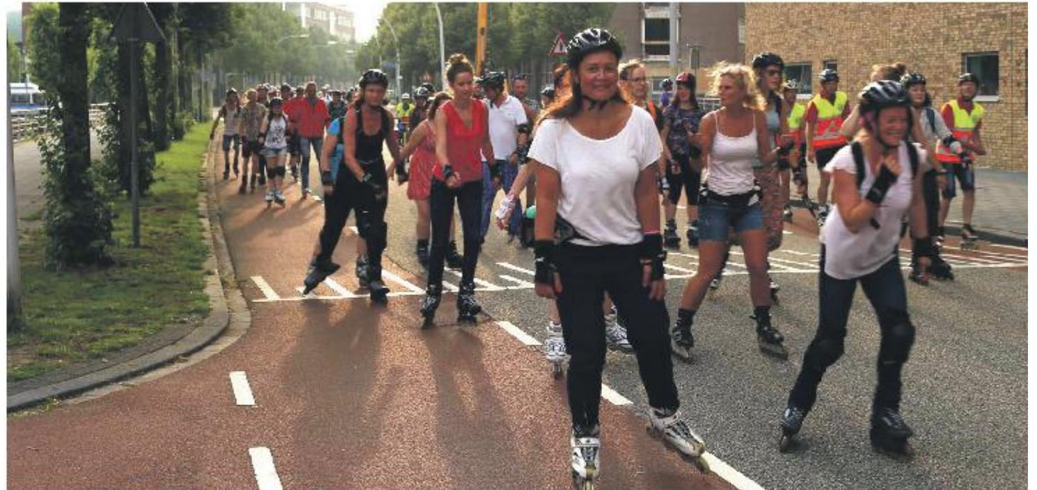
Een sportief evenement met Zwolle als decor.

De sponsor Lindeholz Rouveen is aanwezig met een beperkt aantal leenhelmen. Ze stelt ook gratis skates beschikbaar om uit te proberen voor wie die zelf niet heeft. Halverwege de tocht is er een pauze. Net zoals de routes is ook de pauzeplaats iedere keer ergens anders. Tijdens de pauze is bij de organisatie een flesje water te kopen voor €1,00. Wie geen lampjes