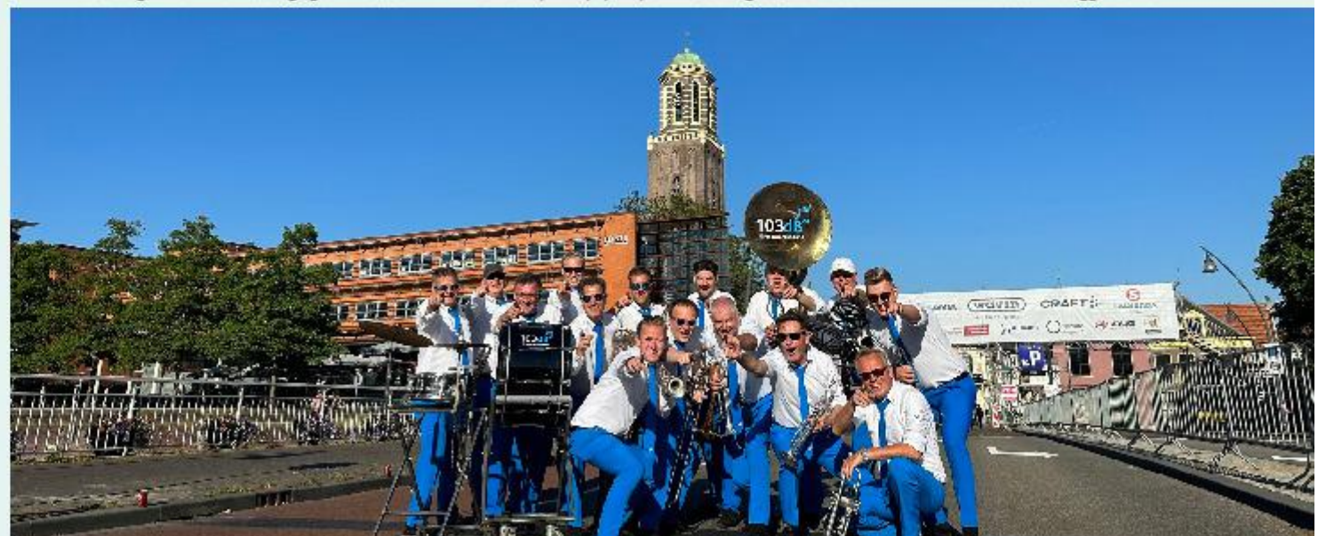
The sky is the limit' bij 103dB.