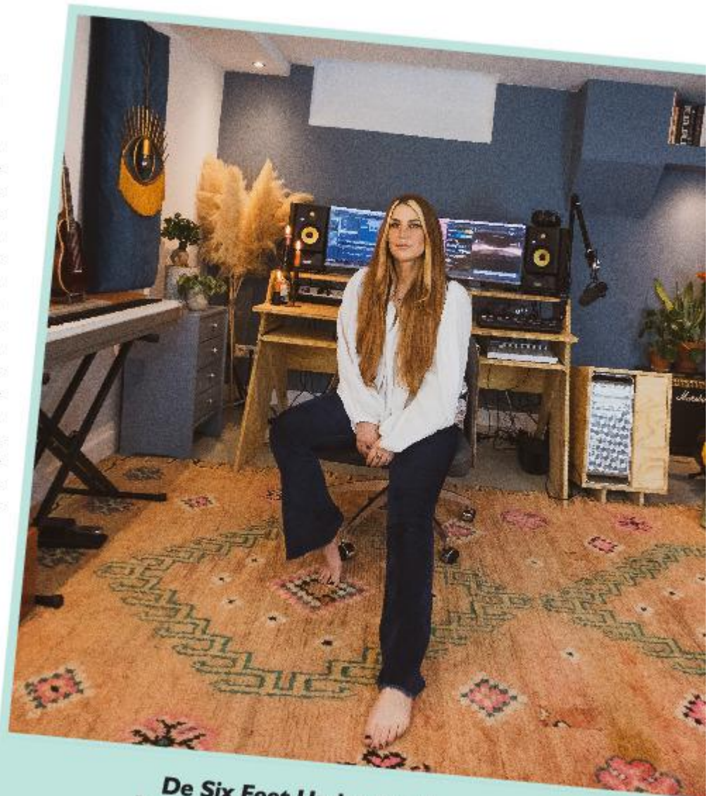
De Six Feet Under Studio, anno 2020.