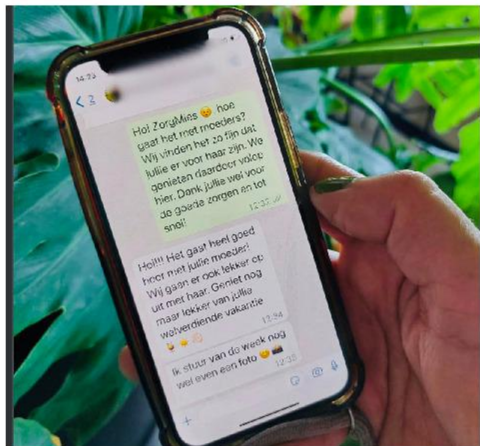
Geen zorgen tijdens de vakantie.

"Dat kan dus ook voor een kortere periode of op afroep, als de reguliere zorgverlener even niet beschikbaar is. Onze slogan 'ZorgMies maakt het leven leuker' gaat dus niet alleen op voor degene die zorg nodig heeft, maar ook voor de gever. Want onze ZorgMies - en ZorgSiemen - kunnen hun werk overnemen."