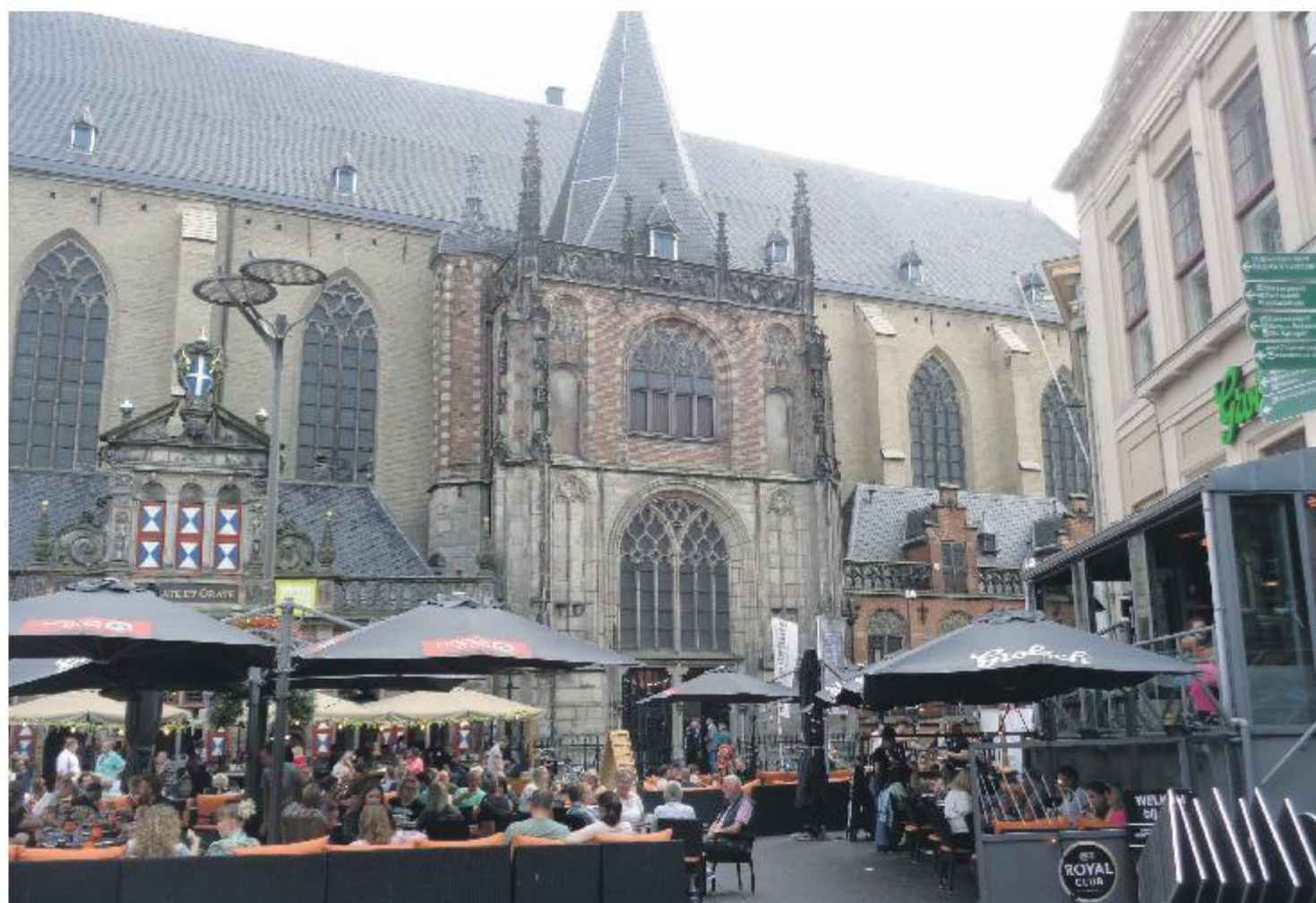
Op de achtergrond het Academiehuis.

Voor meer informatie en het bestellen van kaarten: www.zwollebaroque.nl .