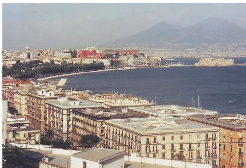
Studeren of stagebben in het buitenland? Ook daarover is op de beurs veel informatie te krijgen.

Tijdens een expeditie is zelfkennis belangrijk. Een goede studiekeuze start bij jezelf. Wie ben je en waar ben je goed in? Dat zijn belangrijke vragen om je jezelf te stellen. Op de Onderwijsbeurs Noordoost kun je hier hulp bij krijgen. Ga bijvoorbeeld eens naar de Sterke Punten Training en ontdek je kwaliteiten. Of bezoek andere studiekeuze-sessies met onderwerpen als: studeren in het hoger onderwijs, een tussenjaar, het studiekeuzeprocess en een buitenlandavontuur. De sessies vinden op beide dagen plaats in zaal I. Ook heel interessant natuurlijk voor ouders van scholieren. Wat je leuk vindt, daar ben je vaak goed in, al is het soms best moeilijk om dat over jezelf te zeggen. Daarom kun je op de beurs verschillende Interessegebied Voorlichtingen volgen op mbo-, hbo- en wo-niveau. Hier leer je meer over wat je allemaal kunt studeren als je bijvoorbeeld economie of techniek leuk vindt. Op de beurs zijn gidsen aanwezig die je wegwijs maken in het oerwoud aan studierichtingen. (Oud-)studenten en voorlichters van