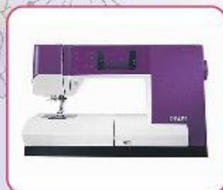
Pfaff expression 710

Reparatie alle bekende merken naai- lockmachines & gratis parkeren voor de deur