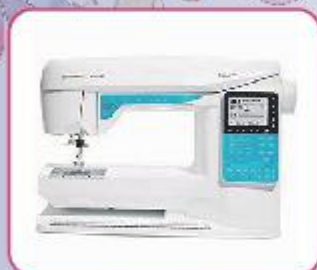
Husqvarna Opal 650

Van onze demonstratie en show modellen Naaimachines – lockmachines – Borduur machines voor een hele scherpe prijs