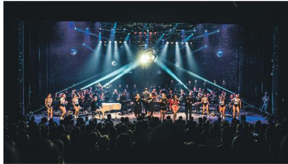
Het Thomas Orkest eerder dit jaar in De Spiegel met de show 'Let's Dance'.