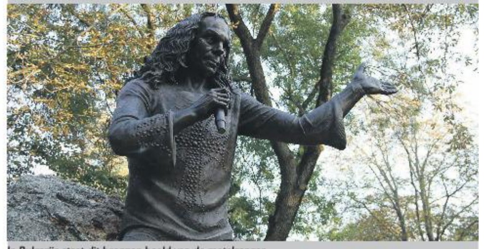
In Bulgarije staat dit bronzen beeld van de metalzanger.