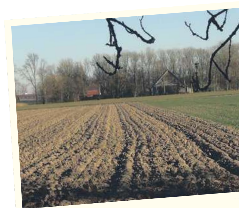
Landerijen in winterrust

Nu hadden we bericht gehad dat de Goedheiligman ons al op zondag een bezoek ging brengen en we zouden daarvoor bij één van de kinderen op bezoek gaan op zondag rond half elf. De zondagsrust heb ik deze keer maar genegeerd en bij het eerste licht om 8 uur zat ik weer op de trekker. Ik zag dat de burens verderop ook weer bezig waren. Het lukte me maar niet om er achter te komen waar ze nu mee bezig waren. Ik zag wel dat er bulten gestort werden maar dan konden het nog steeds bieten of witlof zijn. Ik had de oplossing om er achter te komen. Als we straks naar Emmeloord gaan neem ik een andere route zodat ik kan zien wat daar ligt! Verder ploegen tot tien uur, en snel naar huis. Omkleeden en rijdend langs de mysterieuze bulten blijken het toch bieten te zijn. Ze liggen er waarachtig nog redelijk schoon bij. Verder geheel "ontspannen" de Sinterklaasviering uitgezeten. Om twee uur weer op het land. Ik had mijn vrouw al verteld dat ik alleen thuis kom als het te hard ging sneeuwen. Intussen probeerde ik uit te rekenen hoe lang ik werk zou hebben om het achterste perceel klaar te krijgen. Het zou net moeten lukken voordat het donker is. Dat zou mooi uit komen, want het is lastig om in het donker een mooie aansluiting te krijgen met het tarwe perceel. Net op tijd. En prima gelukt.