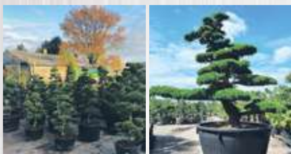
Vormsnoei / Tuin Bonsai

Dat geldt voor bijna alle planten. In de herfst is het minder warm en valt er meer regen dan in het voorjaar, je hoeft daarom minder water te geven. De grond is in de herfst nog wel vrij warm, de planten gaan zich voorbereiden op de winter en groeien ondergronds nog flink door.