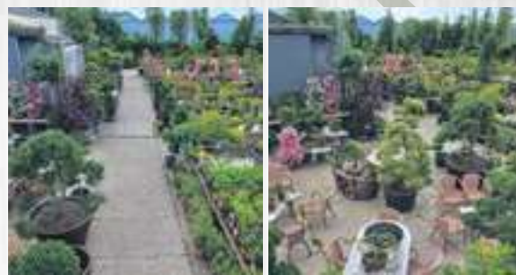
Bijzondere bomen en Heesters (Magnolia, taxus, naaldbomen enz.)