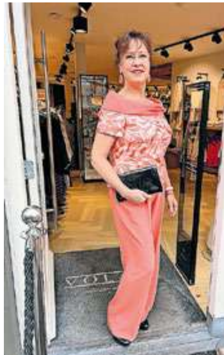
Een item uit de collectie voor moeders van aanstaande bruiden.

Zeker in een moderne stad als Zwolle zijn trends leidend bij wat je op straat aan kleding ziet. "Je ziet dat strak aan