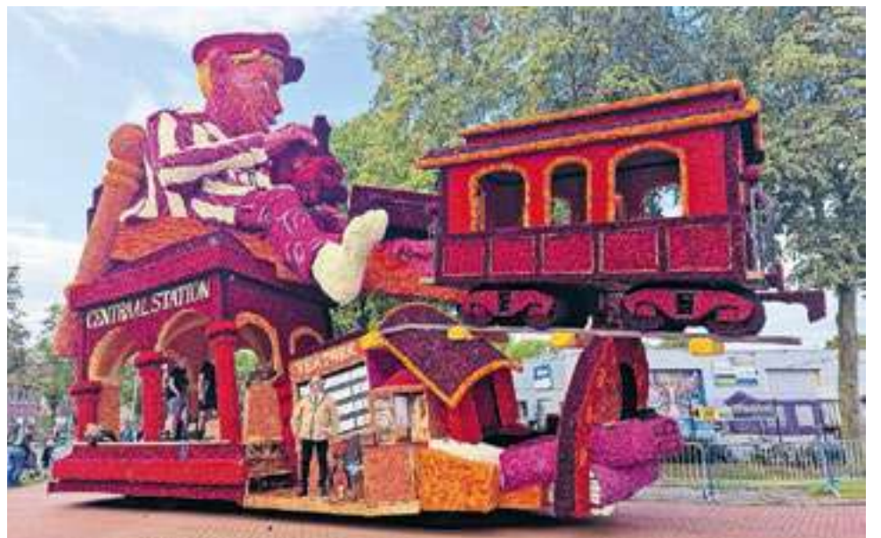
Twee Nijenhuisen wint ereprijs met ontwerp 'Droombaan' (2023).

In 2019 is de corsogroep 2NH (Twee Nijenhuisen) uit nieuwsgierigheid met het idee gekomen om buitenstaanders met een open inschrijving te laten komen voor een ontwerp. Patrick van Dijk (33) uit Vollenhove is lid van deze groep en vindt dit initiatief een goed idee. "We hebben nu veel meer keuze uit ontwerpen en hoeven niet alleen naar ontwerpen te kijken van onze eigen leden. Dit kan voor beide kanten goed uitpakken. Wie weet zit er een ereprijs tussen bij een van de aangeleverde ontwerpen." De groep presenteerde in 2019 'Worsteling'. Dit ontwerp is toen ingediend door een externe ontwerper. Het afgelopen jaar heeft 2NH de ereprijs gewonnen met het ontwerp 'Droombaan', bedacht door