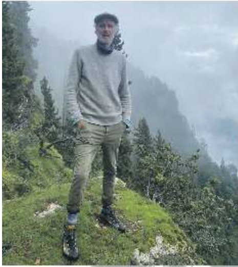
Zaden winnen van palmen op 2700m hoogte

Al snel wordt in een tussenwoning de kelder en de zolder geclaimd om zaden te kiemen. Al snel loopt de hobby uit de hand en binnen enkele jaren zijn er behoorlijke aantallen en vooral vele