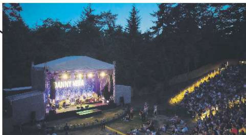
Ook Ise DeLange deed het Bostheater aan, in haar eigen Overijssel.