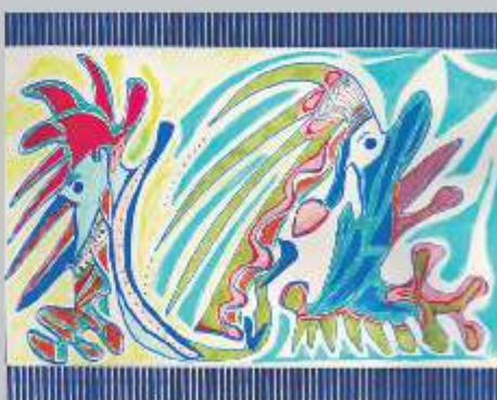
Intuïtieve kunst.

Kijk voor meer informatie op https://deveranderingzwolle.nl/ .