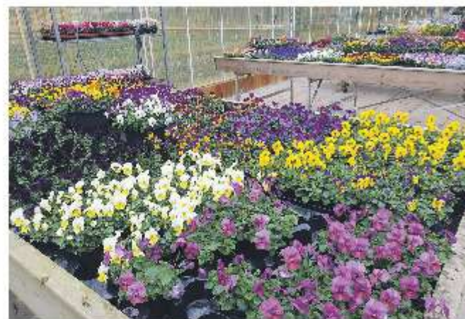
Het hele jaar door kweken.

Belangstellenden worden dus opgeroepen om niet te lang te wachten met inschrijven. De verwachting is dat de eerste tuintjes rond juli verhuurd kunnen worden. Uitgifte van de tuintjes vindt plaats op volgorde van inschrijving.