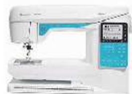
Husqvarna Viking Model Opal 650

Op vrijdag 14 en zaterdag 15 april demonstratie dagen van Babylock - Lockmachines en coverlocks.