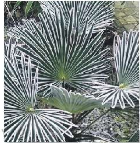
Bij vorst worden randen van de bladeren van de Trachycarpus wagnerianus veelal wit