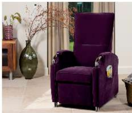
Een ruim aanbod in op maat gemaakte Fitform wellness stoelen.