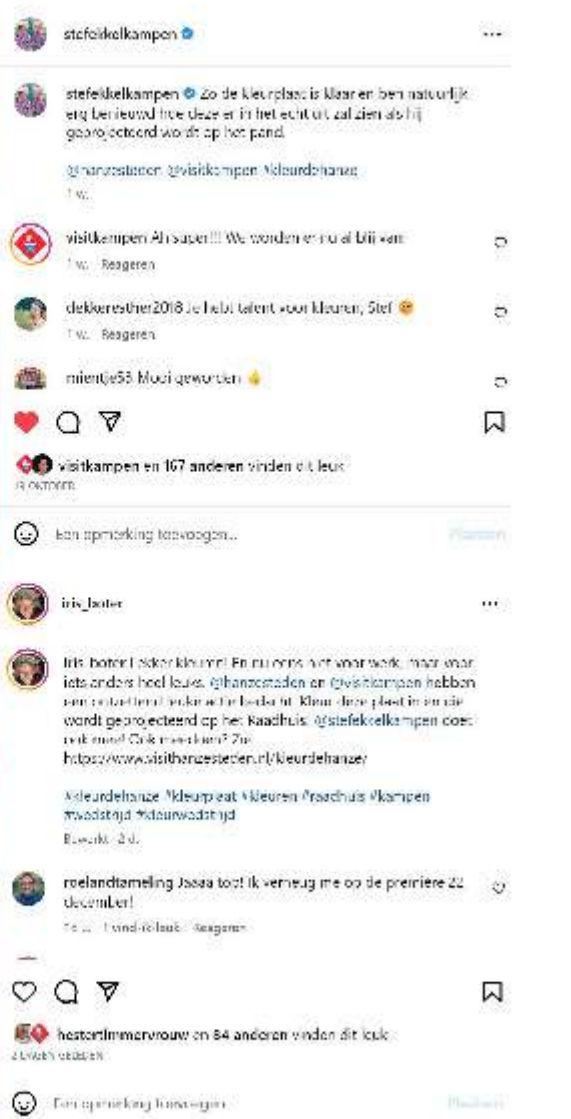
Foto's: inzendingen Iris Boter, Bas Wonink en Stef Ekkel voor Kleur de Hanze in Kampen