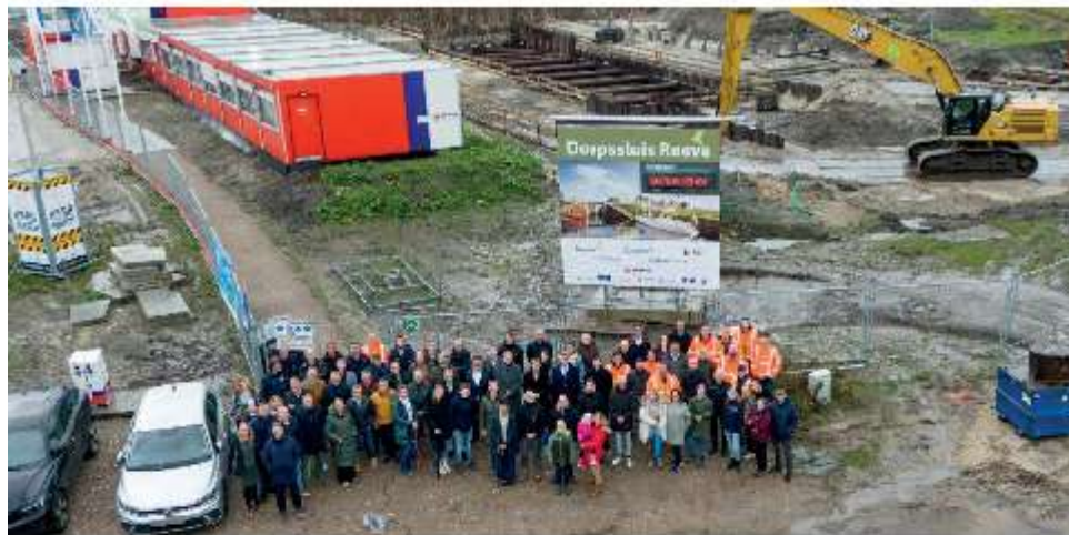
Alle genodigden op de foto bij het bouwbord met op de achtergrond de sluis.