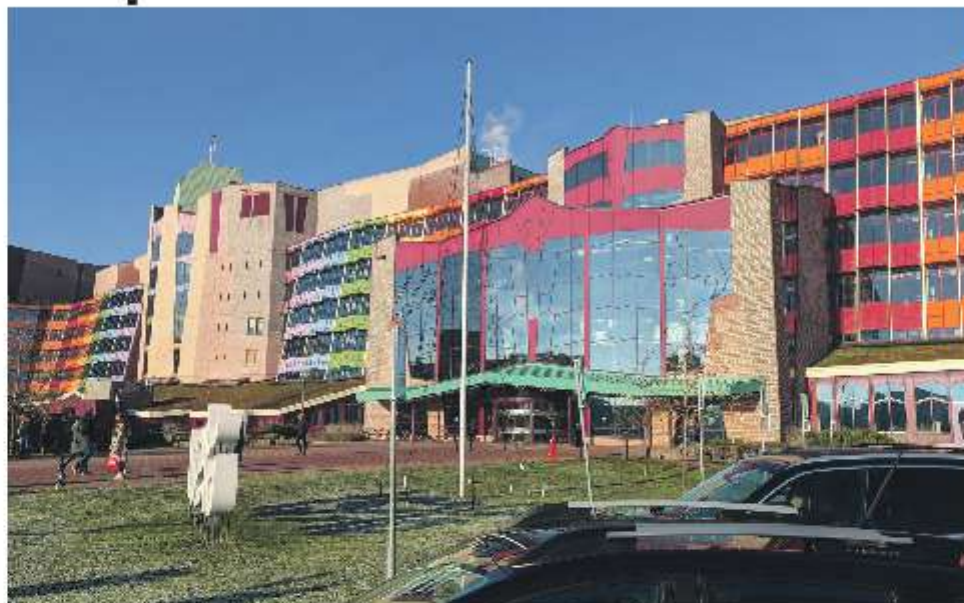
Er is monnikenwerk verricht in het Isala.

Omdat de TAD-procedure relatief nieuw is, was er nog weinig bekend over de effectiviteit ervan. Dat Zwolle hierin het voortouw nam, is volgens Maarten geen toeval. "Isala is een