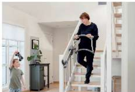
Veiliger op de trap. Ook deze traphulp is verkrijgbaar bij Maxvitaal.