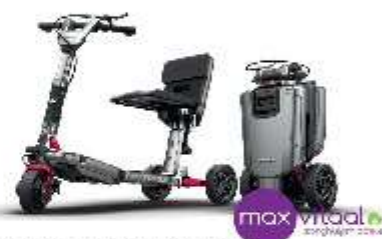
De opvouwbare scootmobiel Mobio ATTO Sport.