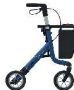
Een van de vele rollators in het assortiment.

Maxvitaal Traktieweg 12 8304 BA Emmeloord Telefoon 0527 - 860 086 info@max-vitaal.nl (mèt koppeltaken!) Parkeerplaatsen aanwezig