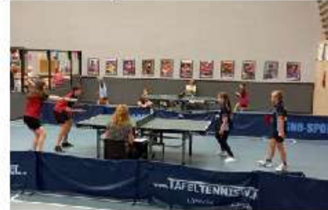
De zaal van Kampenion.

De najaarscompetitie voor tafeltennisvereniging Kampenion loopt ten einde, zowel voor de senioren als voor de jeugd. Maar dat betekent niet dat de club stil gaat zitten. De trainingen gaan gewoon door en er wordt druk gewerkt aan de voorbereiding van nieuwe activiteiten.