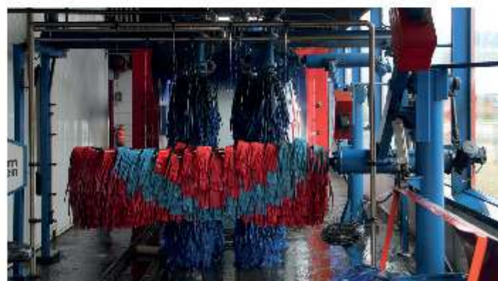
De WasMij Budget Carwash aan de binnenkant.

WasMij Kievitstraat 2b 8262 AD Kampen www.wasmij.nl info@wasmij.nl Telefoon (038) 20 03 040