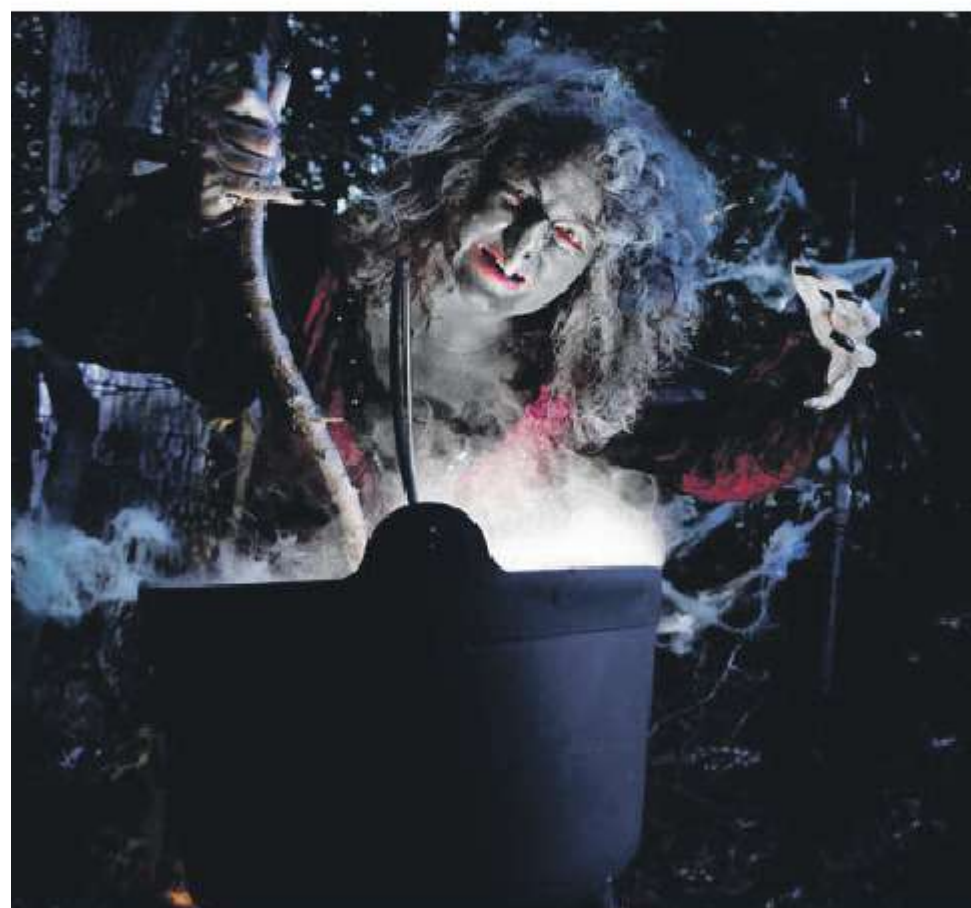
Wie durft achter Grýla aan te gaan?

Kunst- en Kerstmarkt in de Luttekestraat