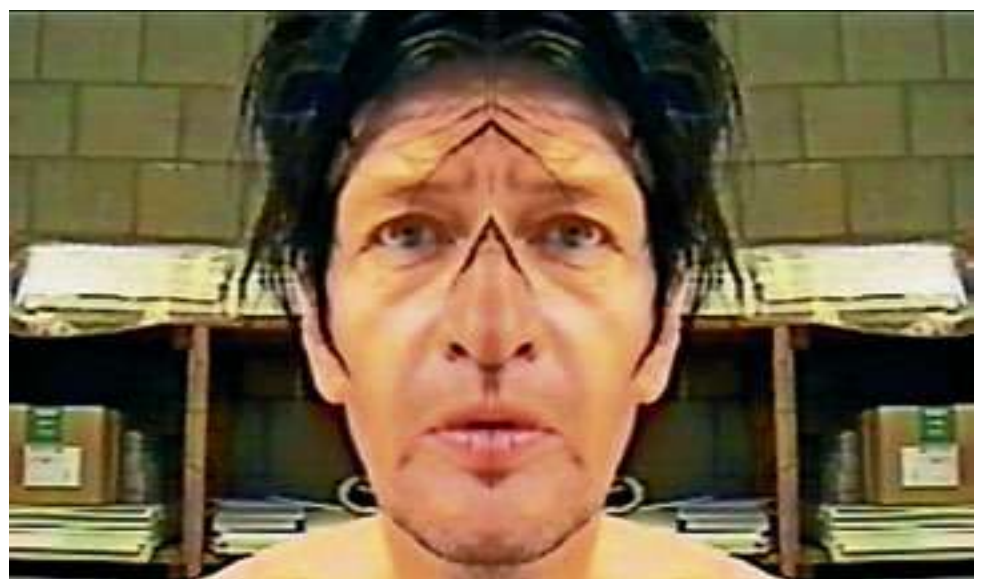
De 'linkerkant' van Brood