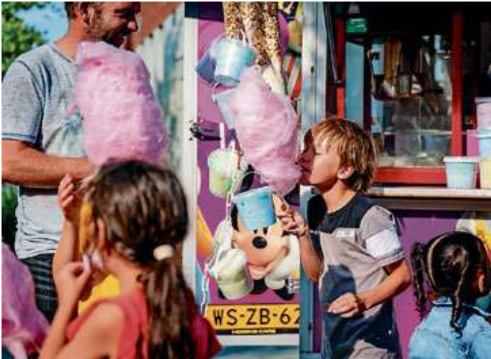
Ook dit jaar zijn diverse foodtrucks aanwezig.