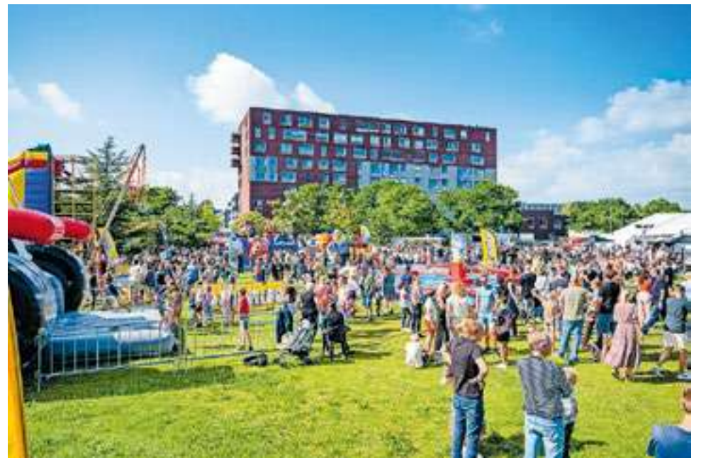
Gezellige drukte in het Twistvlietpark tijdens een eerdere editie.

Het Stadshagenfestival heeft altijd een karakter van 'van en door Stadshagenaren' gehad. In de organisatie is het een klein team dat de werkgroep vormt, maar tijdens het evenement zelf werken er meer dan vijftig Stadshagenaren om van het festival een succes te maken. Er is dan ook een aantal vaste vrijwilligers die inmiddels door en door weten hoe dit festival georganiseerd wordt en zij vinden het heerlijk om weer met elkaar aan de slag te gaan. Omliggende bedrijven helpen ook graag mee door een internetverbinding én een waterleiding aan te bieden, waar de organisatie dankbaar gebruik van maakt. De winkeliersvereniging helpt met de PR, zoals het drukwerk, en organiseert bovendien ook