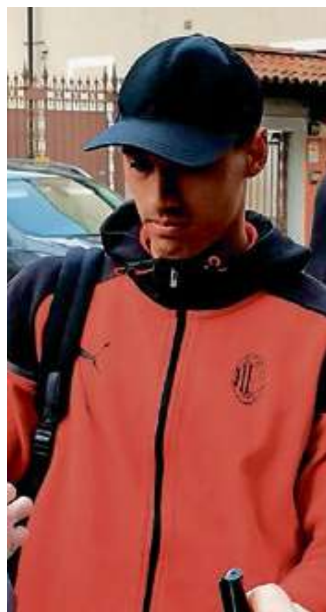
Zwollenaar Tijjani Reijnders komt met zijn club AC Milan aan bij een hotel.

Reijnders maakt sinds mei dit jaar deel uit van de Oranje-selectie. Hij had ook voor het nationale elftal van Indonesië kunnen spelen, want zijn moeder is half Nederlands, half Moluks. Begin 2022 werd Reijnders benaderd voor een interlandcarrière voor Indonesië, maar hij koos om te spelen voor