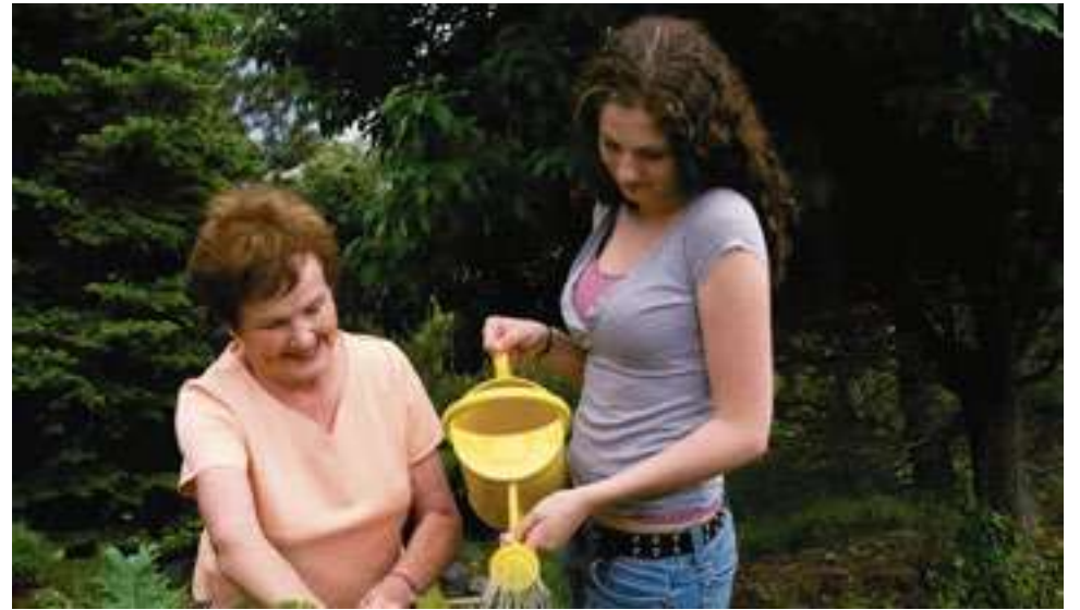
Iedereen kan een verschil maken voor iemand anders.

Wil je kijken of je een match hebt met iemand? Kijk dan op https://samenzwolle.nl voor alle maatjesvragen.