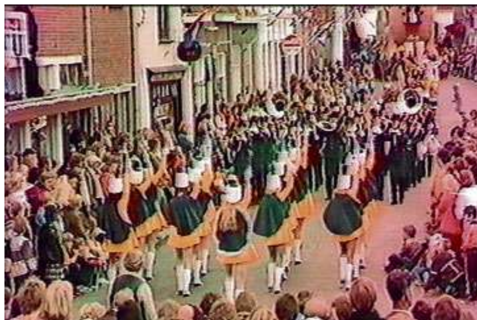
Voorwaarts was er vaak bij, hier met het tamboer- en trompetterkorps met de kenmerkende sound met jachthoorns.