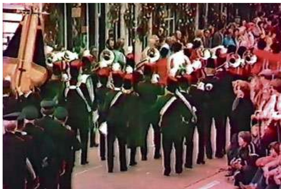
De PTT-korpsen, voorop het tamboer- en trompetterkorps, daarachter de harmonie. Ook hier jachthoorns.

Voor de liefhebbers van het traditionele muzikale marcheerwerk zijn dit jaar in Vollenhove aanwezig: Vollenhoofsch Fanfare, Jong K&G uit Leiden, DVS Junioren uit Katwijk, Blue Seals uit Zeewolde, Euroband uit Rotterdam, Showband Corio uit Heelen, Edelweiss uit Heerlen en St. Joris Showband uit Hoogeloon. Voor degenen die de snelle pasjes en shows van bands als Jubal en Advendo uit Sneek kan bekoren, is er alleen nog het Pasveerkorps uit Leeuwarden. Geen van deze orkesten zal een show opvoeren tijdens de taptoe (tegenwoordig in Vollenhove ‘bandshow’ geheten) na het middagcorso, waaraan in vroeger jaren in elk geval zowel Jubal als Voorwaarts meegedaan heeft. De bandshow is afgelast vanwege de lagere bezetting van de muziekkorpsen in verband