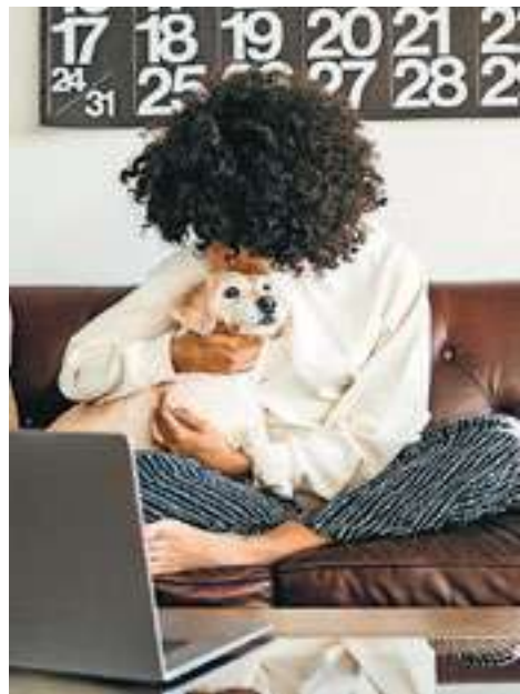
Welke hond je hebt, zegt het nodige over hoe je bent.

'Goh, die hond lijkt op zijn baasje', wordt wel eens gezegd. Dat kan kloppen, want bij elk hondenras past een ander soort baasje. Zijn of haar hondenvoorkeur zegt daarom ook veel over de persoonlijkheid. Een onderzoek van the Kennelclub in Engeland bevestigt dit. De organisatie bevroeg via een enquête 1500 hondenbaasjes. Zij namen daarbij de volgende vijf persoonlijkheidskenmerken onder de loep: neuroticisme versus stabiliteit, extravertie versus introvertie, openheid voor ervaring versus geslotenheid, zorgvuldigheid versus laksheid en vriendelijkheid versus antagonisme.