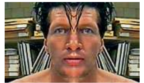
De 'rechterkant' van Brood