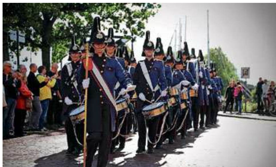
Meervoudig wereldkampioen Pasveerkorps zal in Vollenhove zorgen voor wat showelementen.

Corso Vollenhove, zaterdag 24 augustus. Met om 10.00 uur het jeugdcorso, om 14.00 uur het middagcorso, om 20.30 uur het sfeervol verlichte avondcorso en tussendoor dweilorkesten en nog veel meer. Voor informatie: www.corso-vollenhove.nl .