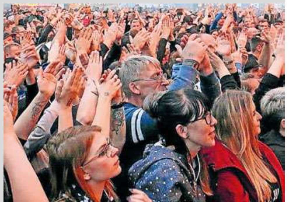
Foto: Schuim de kroegen af of blijf hangen bij een van de podia op het Straatfestival.

Mis deze onvergetelijke dagen niet en zet ze vast in je agenda: vrijdag 23 en zaterdag 24 augustus vanaf 19.00 uur. Details over het programma volgen binnenkort.