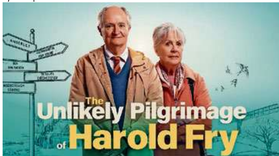
Veel Britse landschappen in de film The Unlikely Pilgrimage of Harold Fry.

Iedereen is welkom om te genieten van deze topfilm, het jaarlijkse Zwolse filmcadeau in een bijzondere ambiance. De toegang is gratis en stoeltjes zijn aanwezig, maar kom op tijd in verband met het beperkte aantal plaatsen. Start film om 21.30 uur. Duur van de film: 108 minuten.