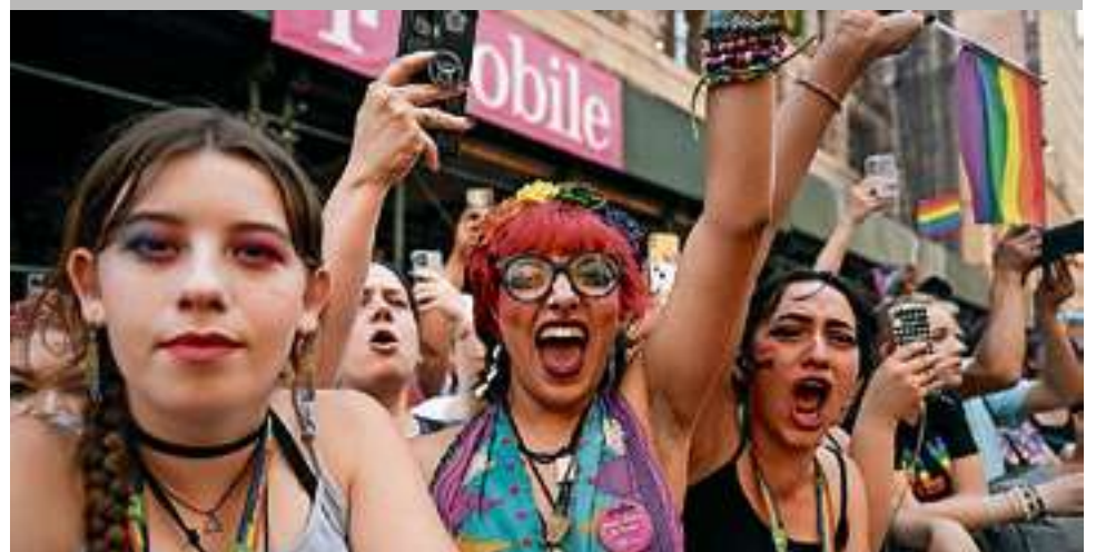
Ook Hanzestad Zwolle staat drie dagen in het teken van de regenboogkleuren.

Meer informatie over het festival is te vinden op www.zwollepride.nl .