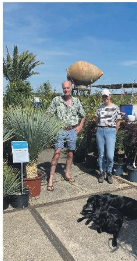
MyPalmShop: niet te missen bij de oprit Wezep richting Amersfoort.

MyPalmShop, Zuiderzeestraatweg 452, 8091 PB Wezep mypalmshop.nl 06 4024 3314