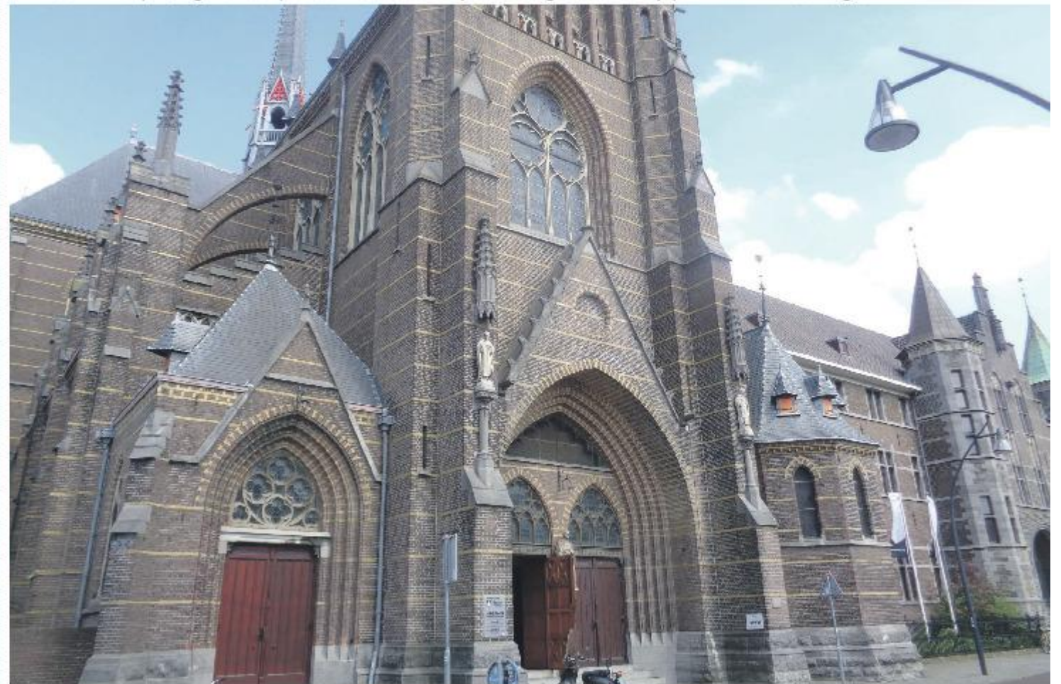
Het Dominicanenklooster aan de Assendorperstraat is een van de Zwolse iconen en getuigt van het roomse leven in de stad.

En natuurlijk zijn er veel meer mooie plekken om eens met andere ogen te bekijken. Wie graag in de buitenlucht van Zwolle geniet, kan zijn of hart ophalen met de vele stadswandelingen en rondvaarten die in de stad plaatsvinden. Voor een overzicht zie www.zwollemetgids.nl .