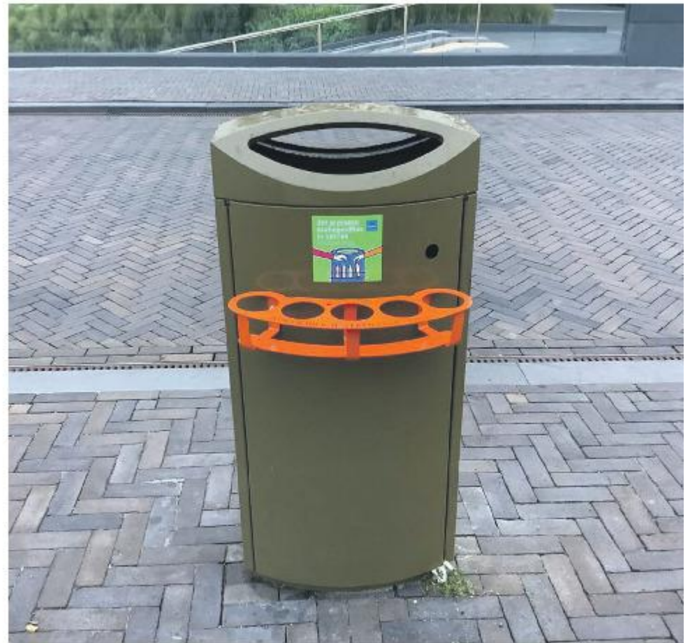
Eén van de doneerringen bevindt zich op het Stationsplein, aan de voorzijde van het station.

Het idee van de doneerringen is niet nieuw. In Duitsland is de zogenaamde 'Pfandring' al helemaal ingeburgerd; daar hangen de doneerringen al in meer dan honderd steden. Ook in Nederland is het initiatief aan