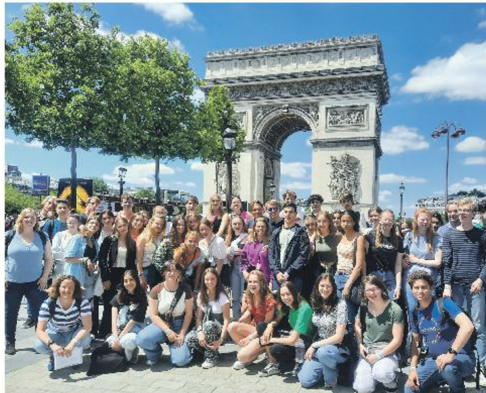
Foto: De leerlingen Frans voor de Arc de Triomphe in Parijs

In drie dagen kwamen alle hoogtepunten (letterlijk soms, denk Eiffeltoren) van de steden voorbij. Het waren een lange dagen, maar heel erg gezellig.