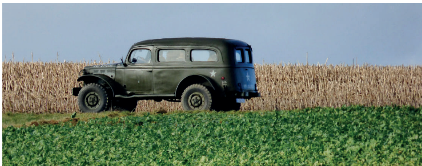
Per legervoertuig worden de bevrijdingsontbijtjes bezorgd.

Een andere activiteit waar de leden van OSW zich op kunnen verheugen is de herstart van jeu de boules. 'In april gaan we weer starten op de banen in de openlucht achter het Cios-terrein', vertelt Held. Ze verzekert dat daar voldoende afstand gehouden kan worden omdat er meerdere banen naast elkaar liggen. De voorstellingen die OSW regelmatig organiseert, kunnen voorlopig nog niet doorgaan. 'Alles ligt een beetje stil. Onze cabaretgroep De Jeugd van Toen kan momenteel niet repeteren, maar we hebben wel net een filmpje op onze facebookpagina gezet. En het optreden van Twee Recht Twee Averecht houden onze leden nog tegoed!'