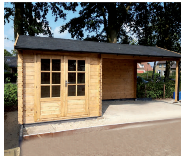
Blokhutten & priëlen