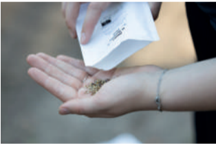
Uit het zaaizaad voor burgers groeien onder andere margrieten.

Met een derde project hoopt ELAN burgers te bereiken. 'We leggen de komende tijd bij boerderijwinkels 2.000 zaaizaadzakjes neer om de bewustwording wat betreft biodiversiteit onder bewoners te vergroten', vertelt Zonderland. De zaaizaadzakjes zijn trouwens ook verkrijgbaar via de site van ELAN. Dit project heeft ELAN vorig jaar ook geïnitieerd. 'Dat was een groot succes, in no time waren alle zakjes weg'. Zonderland raadt mensen aan de zaden na half mei te zaaien, zodat er geen gevaar meer is dat nachtvorst het ontkiemen belemmert. In de loop van de lente en zomer genieten de honderden deelnemers in Weststellingwerf van 5 m2 bloemen zoals: margriet, cichorei, witte klaver, knoopkruid en gewone ereprijs.