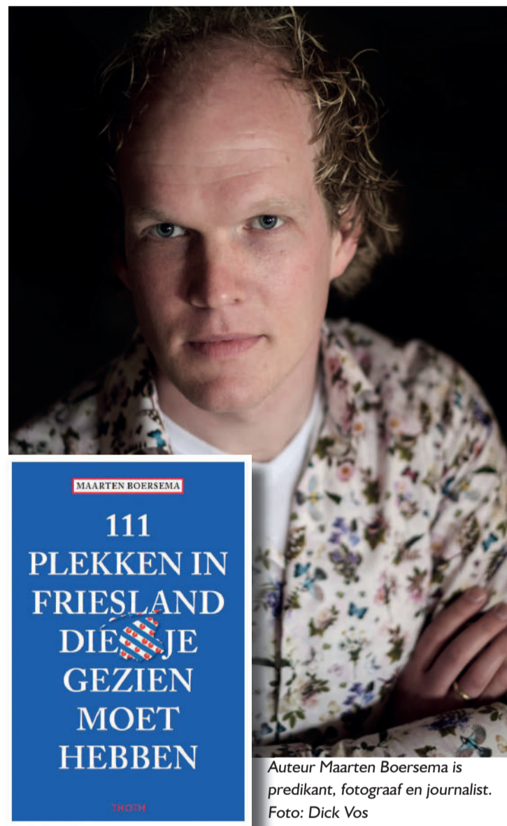
Auteur Maarten Boersema is predikant, fotograaf en journalist.

111 plekken in Friesland die je gezien moet hebben is verkrijgbaar via uitgeverij www.thoth.nl en alle (online) boekhandelaren