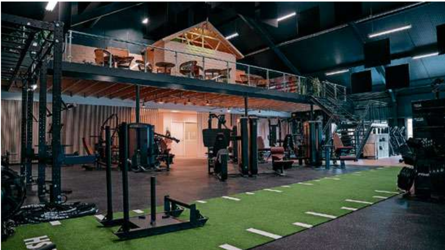
Genoeg sportapparatuur in de sportschool voor jong en oud.