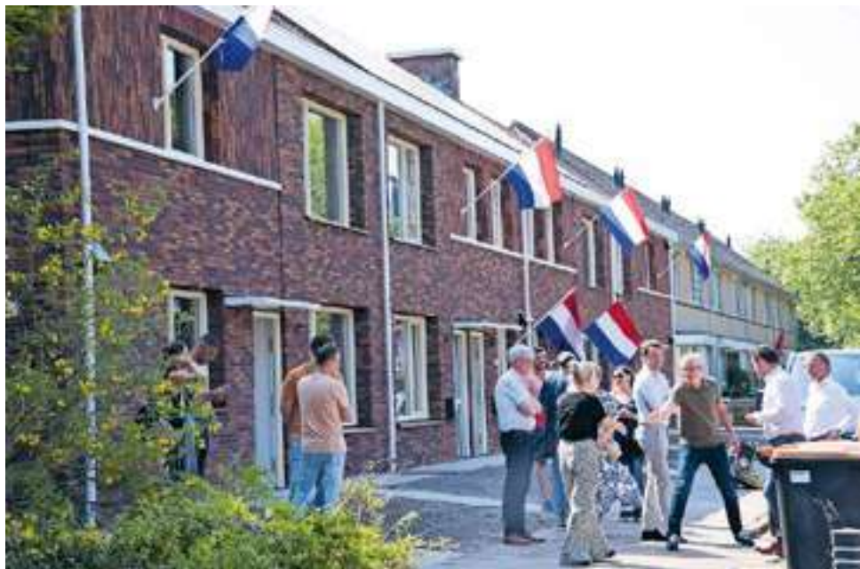
Bewoners en andere belangstellenden nemen een kijkje in de nieuwe woningen.

vertrokken uit de oude huizen, maar de firma Brouwer kreeg opdracht van Woonconcept om de verwarming weer aan te zetten. Anders zouden de vleermuizen het te koud krijgen. Ook landelijke media zoals Hart van Nederland doken op de opmerkelijke situatie in Steenwijk.